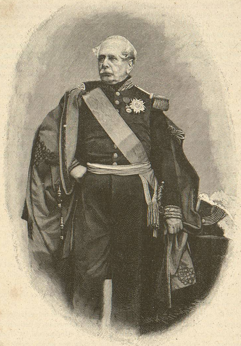
EL MARISCAL RANDÓN; MINISTRO DE LA GUERRA

Son las cinco y media de la tarde; SS. MM. van á subir al coche, y Napoleón III puede contar con una ovación. Los diarios favorables á la causa italiana han preparado bien los ánimos. La tradición liberal es correr en auxilio de los pueblos oprimidos; el principio de las nacionalidades, muy discutido por la aristocracia y la clase media, cuenta con todas las simpatías de los obreros y de los proletarios: es una doctrina esencialmente democrática. Todos los hombres de la izquierda, y hasta muchos de la derecha, no han dejado de preconizarla durante todo el reinado de Luis Felipe y mientras duró la segunda República. El emperador continúa la doctrina de los liberales de la monarquía de