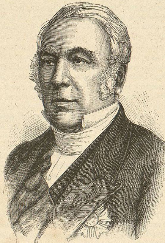
M. Troplong, presidente del Senado

expresa de este modo: «Si me es permitido pronunciar algunas palabras para traducir el sentido de las aclamaciones que se acaban de oír, diré que mientras que mis ilustres colegas, los que ejercen mandos, sostienen frente al enemigo la gloria del nombre francés, los senadores que han quedado aquí no retrocederán ante ningún acto de valor cívico y de fidelidad al emperador. Entre ellos y