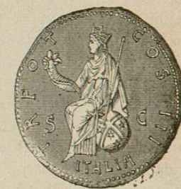
Moneda de Antonino representando la Italia (1)

Esta península es la verdadera Italia, uno de los países más divididos del mundo. En sus innumerables valles, que no todos se comunican fácilmente, tomaron sus gentes ese