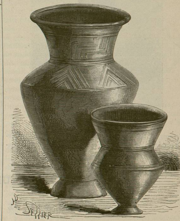
Vasos gálicos de barro cocido (3)

Los monumentos llamados druídicos se elevaron antes