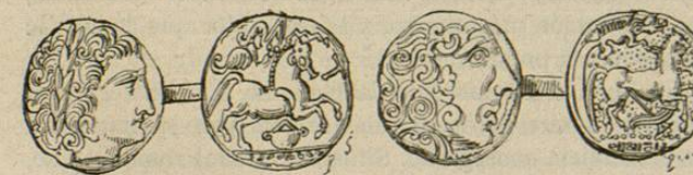
Moneda gala (1)

Sin poder considerarse como un país civilizado, la Ga-