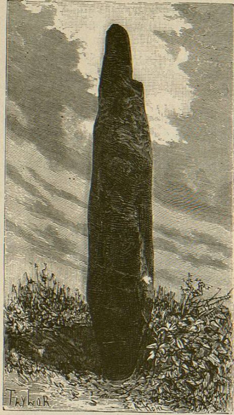
El rey de los menhires de Lock-Maria-Ker (1)

Muchos de los antiguos pueblos formaron, en efecto, sus