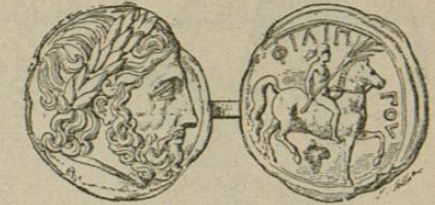
Tetradracma de Filipo (3)

En su tiempo conocían los galos el arte de explotar las minas y lo practicaban con mucha actividad. Los eduos tenían fábricas para trabajar el oro y la plata; los aquitanos para el cobre, los bituriges para el hierro. Este último pueblo hasta había de encontrar el arte de estañar, que hubo de quedar como tradicional entre ellos y sus vecinos los de la Auvernia. Los eduos inventaron también el enchapado y el plateado, y ellos eran los que adornaban así los arreos y arneses de los caballos. El carro del rey Bituit estaba plateado y aun enchapado de plata. Los jefes llevaban cotas de mallas de hierro, reciente invención gala, y á veces corazas doradas; y nuestras colecciones con-