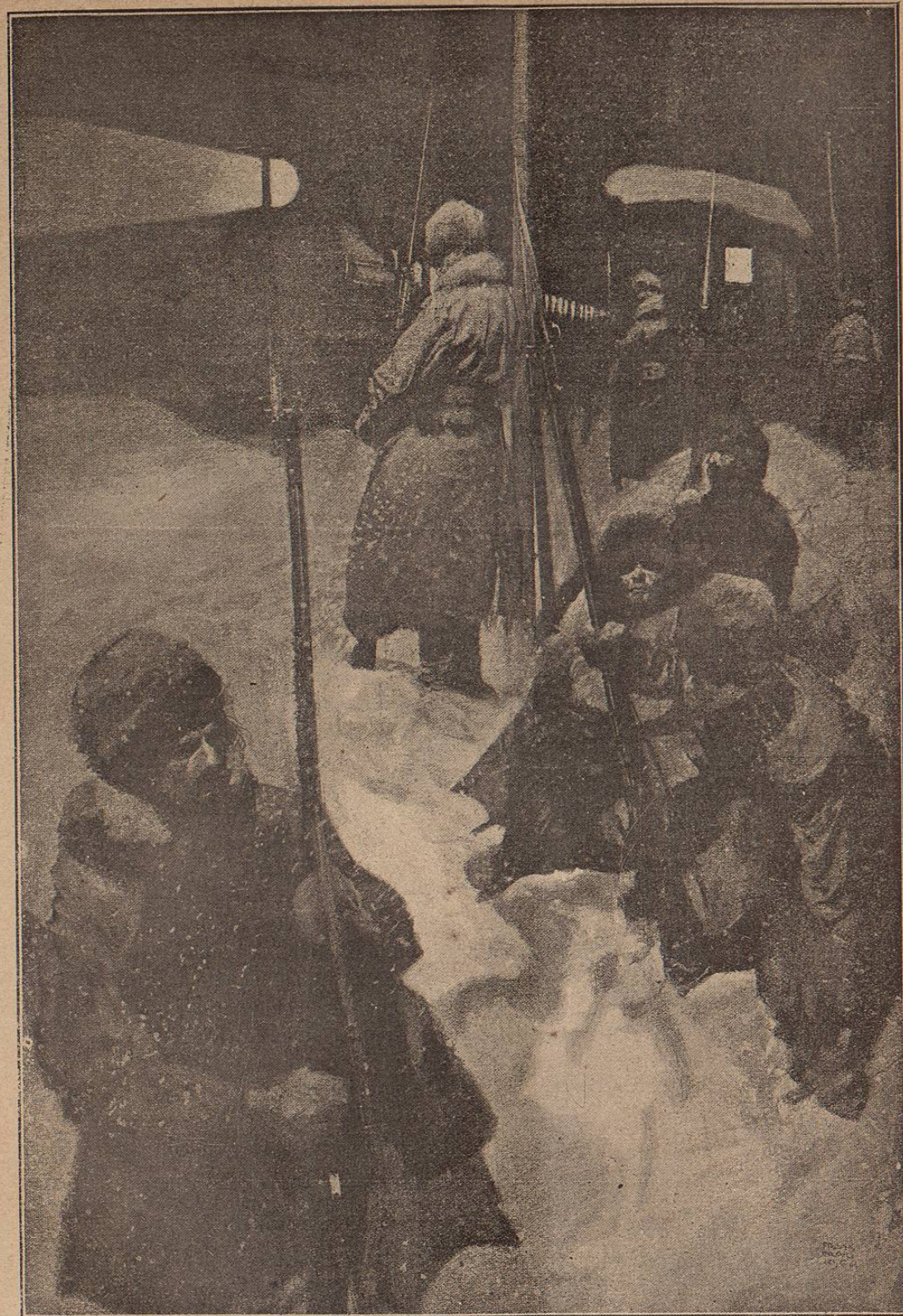
Destacamento ruso, custodiando la vía férrea transmandchuriana

La entrada en su extremo oriental se vé dominada por la Montaña de Oro, acantilado de 125 metros de elevación, inaccesible por completo, y en su meseta hay varias obras de fortificación, unidas entre sí, con soberbios cuarteles á prueba de bomba, y seguros repuestos de municiones. Las pie-