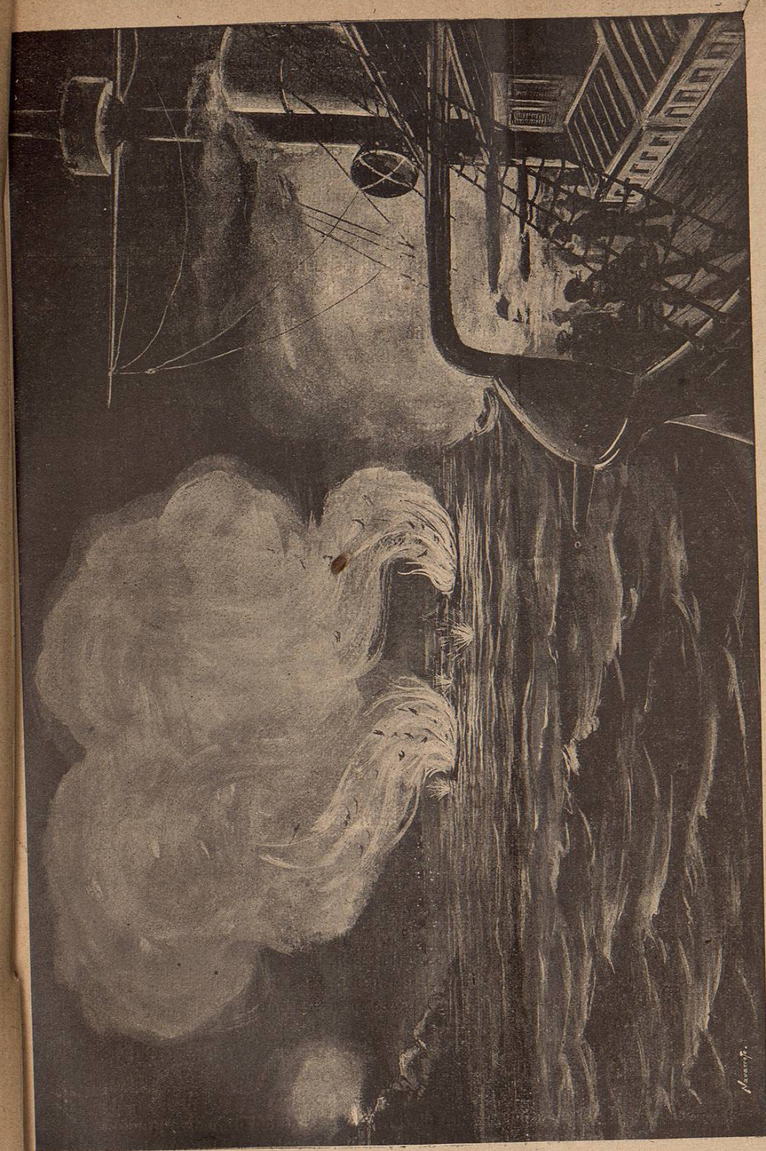
Combate de Port-Artur (25 de Marzo) La escuadra rusa echa á pique los vapores japoneses Chiyō y Fulku

Cuando la escuadra rusa del Báltico llegue al Extremo Oriente, ¿se habrá restablecido el equilibrio naval en favor de Ru-