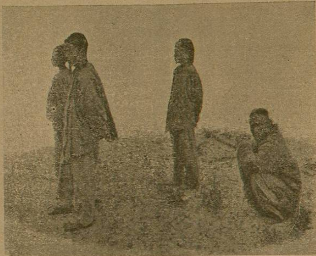
Tipos de habitantes de la Mandchuria