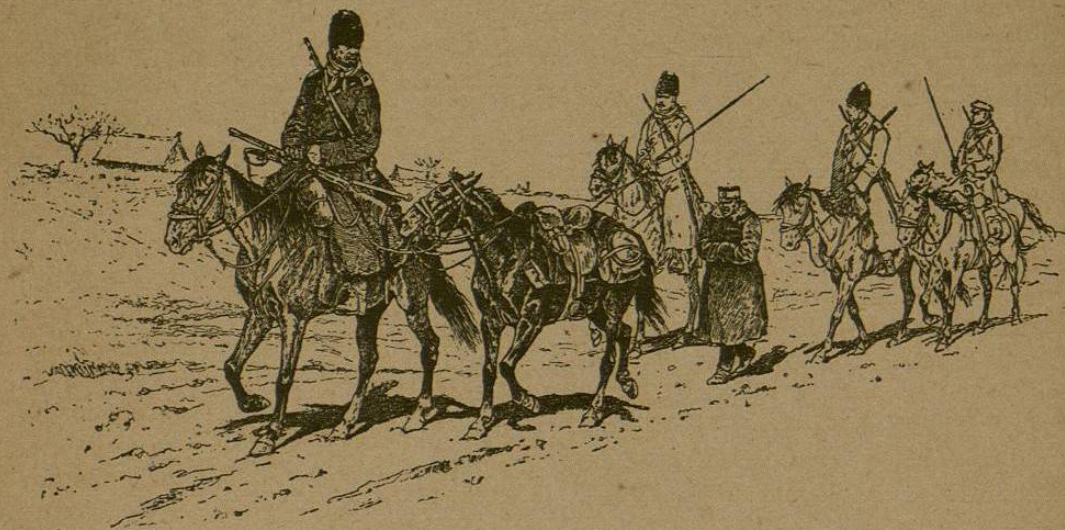
Escortando á un prisionero

SUMARIO: Diario de la guerra, (conclusión).—Fuerza de los ejércitos beligerantes á la terminación de la guerra, por M. de Z.—La civilización japonesa, por el Capitán Subrio Escápula.—Declaraciones de Witte.—El espionaje japonés, por V. K.—La higiene en el ejército japonés.—Crónica de la guerra, por Juan Avilés, comandante de Ingenieros.