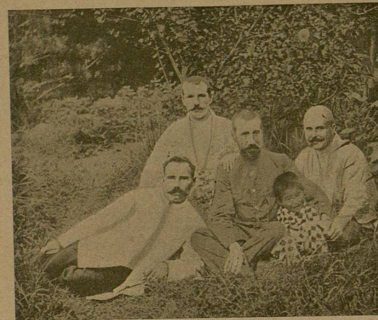
Oficiales de cosacos prisioneros en el Japón

Las 5 brigadas europeas de tiradores, se transformaron en otras tantas divisiones, cuya fuerza parcial se fijó también en 16 batallones y 4 baterías. Con estas divisiones se formaron dos cuerpos mixtos de tiradores.