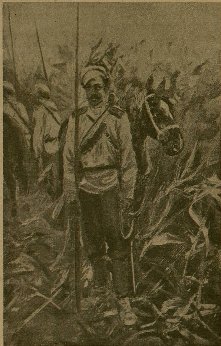
Cosaco del Don

yen un ejército modelo é invencible media un abismo. Ahora el Japón empieza á convertirse en potencia continental, y dentro de algunos años habrá perdido parte de las inmensas ventajas que le da su magnífica situación geográfica. Entonces será cuando podremos comparar.