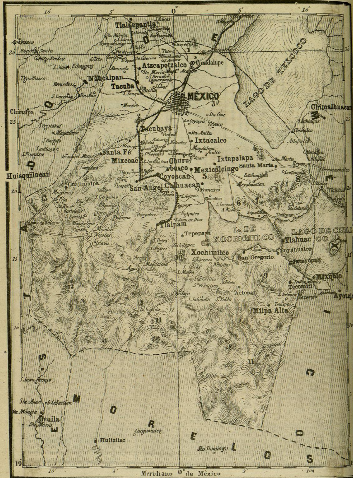
1 Cerros Gachupines, Guerrero y Sta. Isabel.—2 C. Chapultepec.—3 Peñon de los baños.—4 Peñon grande y Sta. Marta. 5 C. de la Estrella ó Ixtapalapa.—6 C. de S. Nicolás.—7 C. Xaltepec.—8 C. Caldera.—9 C. Teutli.—10 C. Xochitepec. 11 Serranía de Ajusco.—12 Picos de Ajusco.—13 Sierra de las Cruces.