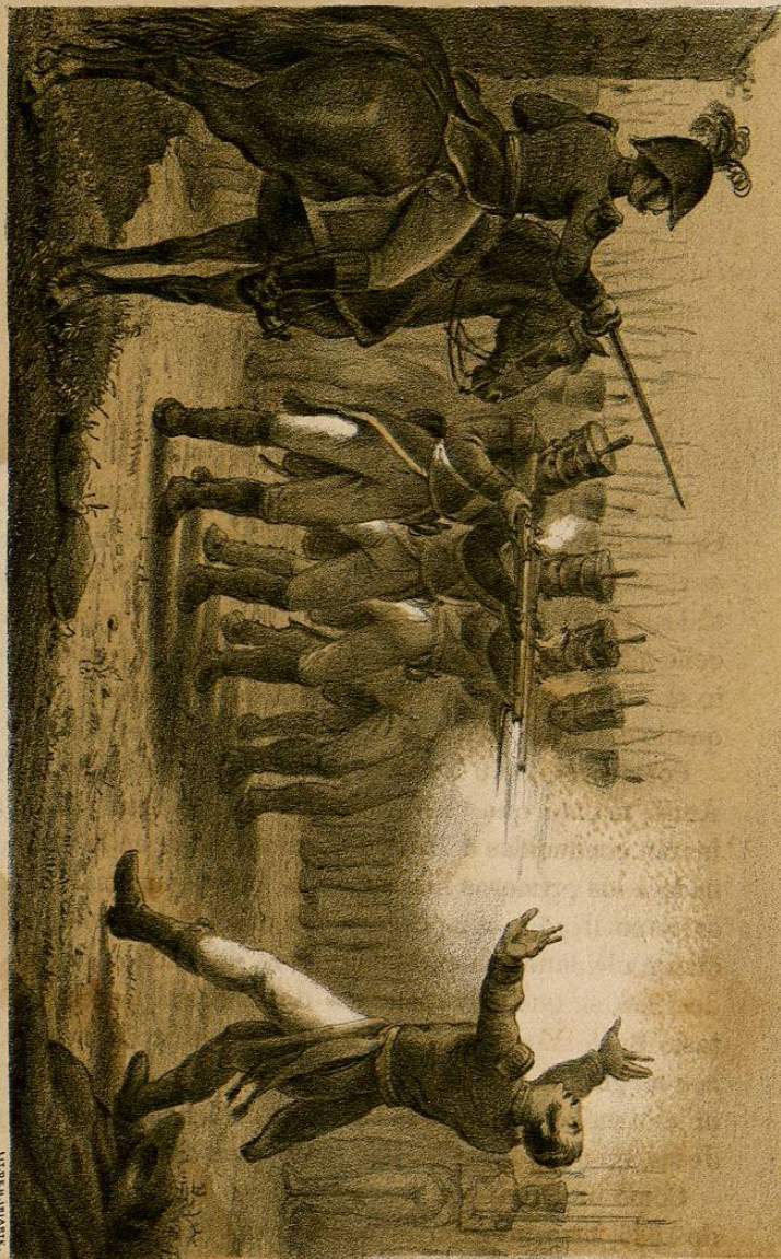
FUSILAMIENTO DE ITURBIDE.