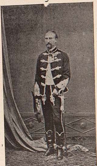
CAPITAN DE HUSARES AUSTRIACOS.