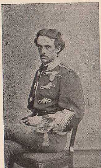
CONDE KIVINHULLER, CORONEL DE HUSARES AUSTRIACOS.