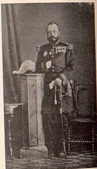
CONDE DE THUN-HOHENSTEIN, GENERAL COMANDANTE DE LA BRIGADA AUSTRO-BELGA.

El tercero, con Mazatlán por capital, se extendía á las demás costas, al norte del expresado Cabo.