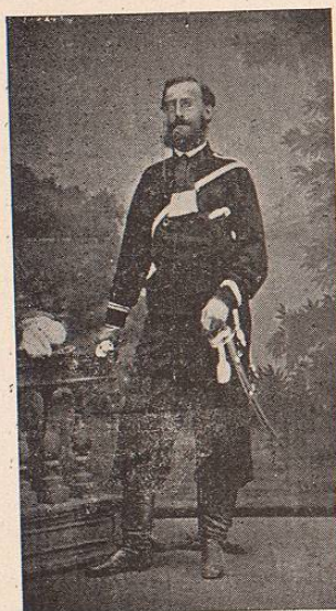
TENIENTE DE CAZADORES AUSTRIACOS. CABALLERIA.