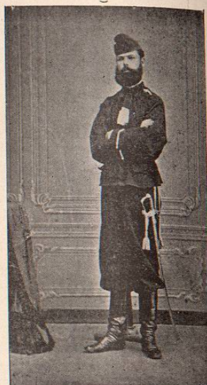
TENIENTE DE CAZADORES AUSTRIACOS. INFANTERIA.