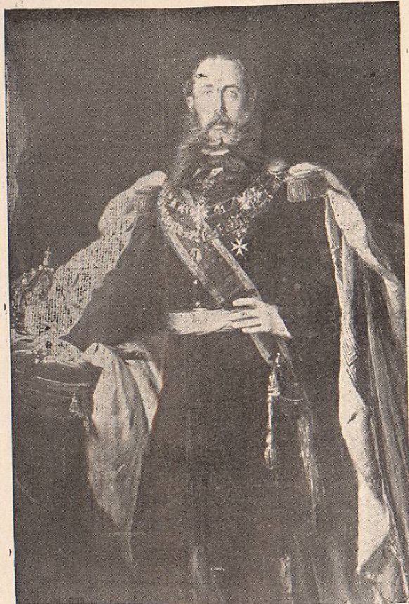
MAXIMILIANO CON LA VESTIDURA IMPERIAL.

Maximiliano y su esposa fueron recibidos en el atrio de la Catedral por las autoridades y empleados, y en el templo, bajo de palio, por los arzobispos de México y Michoacán, algunos obispos y el cabildo eclesiástico. Con las ceremonias acostumbradas, y enmedio de una lujosa concurrencia, se entonó el Tedeum, con-