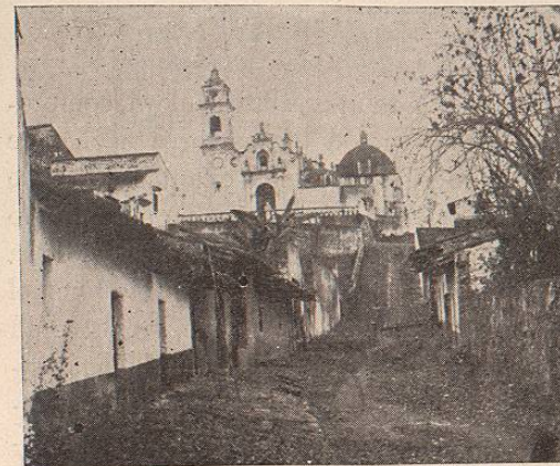
SAN JOSE DE LA CUESTA.

tra en tan bellas condiciones de prosperidad. En mi concepto esa decadencia, por la razón expresada, no puede menos que ser transitoria: la vía férrea de Jalapa reanimará dentro de poco el vigor amortiguado de un pueblo que para su bienestar cuenta con sobrados elementos.