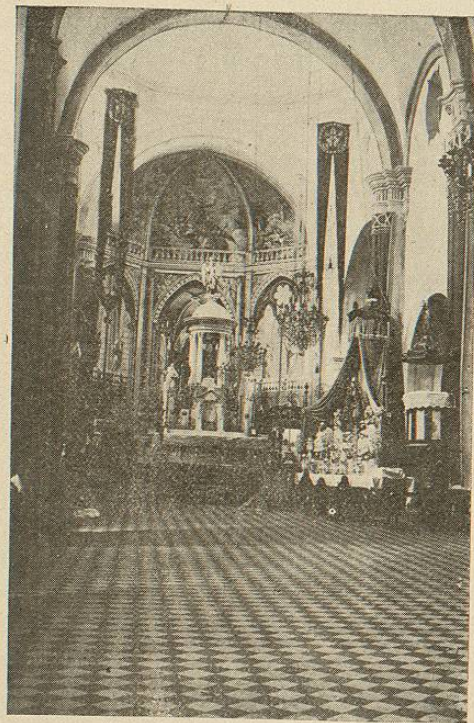
CATEDRAL DE JALAPA (INTERIOR).

Si las bellezas naturales de la encantado-