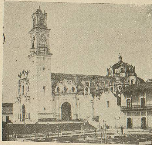
CATEDRAL DE JALAPA.

El clima de Jalapa es templado, agradable y sano. El termómetro, á principios del verano, marca: 20° C. á las ocho de la mañana.