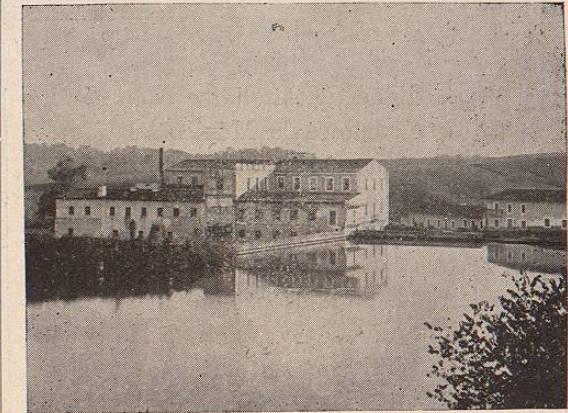
FABRICA "EL DIQUE."

La otra fábrica, con el nombre de "Industria Jalapeña," se halla ubicada en los terrenos más bajos de Jalapa, en el lugar llamado el