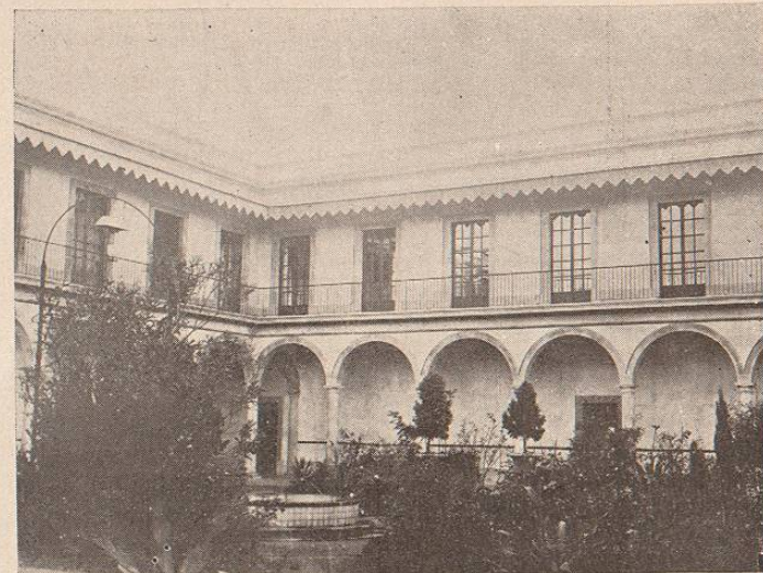
COLEGIO DEL ESTADO, HOY ESCUELA NORMAL.

Si bien es cierto, que en otros lugares de la República los artesanos honrados, rindiendo culto al saber y á la caridad, han creado asociaciones más ó menos numerosas, la que