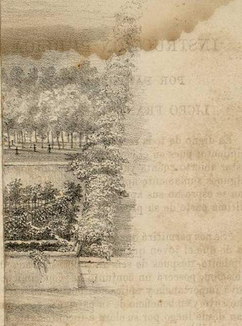
Lito. de Decaen.

“Se nos permitirá que manifestemos la confianza de que el jóven que salga de nuestro establecimiento, despues de seis años de esmerada dedicacion, poseerá un conjunto de conocimientos cuya importancia y aplicacion posible en provecho suyo y en beneficio de su patria, se recomiendan desde luego por su clara é incontestable evidencia. Véase, para que no quepa duda, la escata y breve enumeracion de los varios ramos á que darémos la mas sostenida atencion.