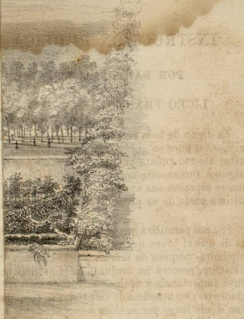
Lito. de Decaen.

“Se nos permitirá que manifestemos la confianza de que el jóven que salga de nuestro establecimiento, despues de seis años de esmerada dedicacion, poseerá un conjunto de conocimientos cuya importancia y aplicacion posible en provecho suyo y en beneficio de su patria, se recomiendan desde luego por su clara é incontestable evidencia. Véase, para que no quepa duda, la escata y breve enumeracion de los varios ramos á que darémos la mas sostenida atencion.