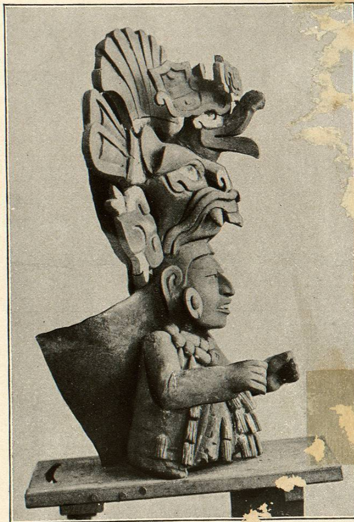
TIPO DEL INDIO ACTUAL COMPARADO CON LA ESCULTURA DE SUS ANTEPASADOS CLASIFICO L. BATRES.