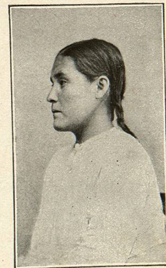
TIPO DEL INDIO ACTUAL COMPARADO CON LAS ESCULTURAS DE SUS ANTEPASADOS