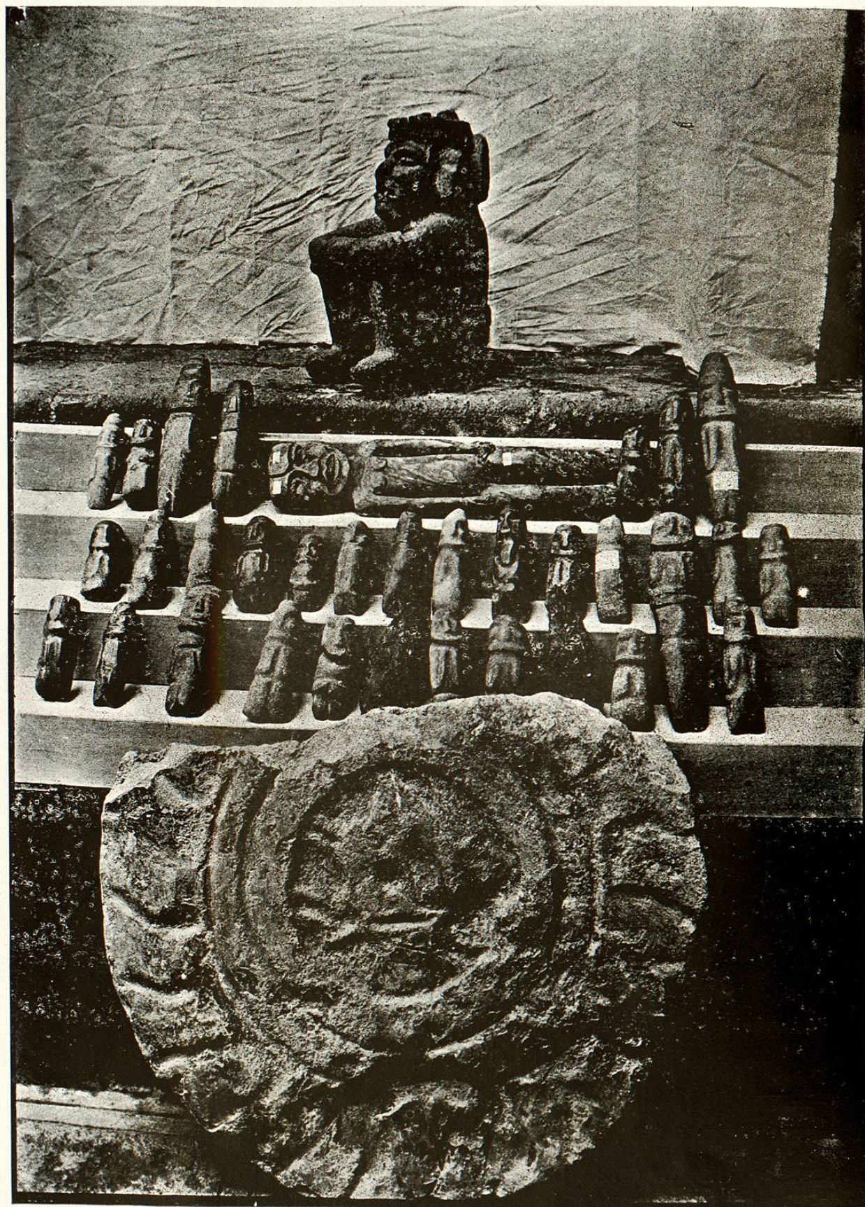
Descubrimiento del día 18 de Octubre.

siblemente laminar, al parecer mujer con los brazos rígidos y colocados á lo largo del cuerpo, mide 0.55 de alto, tiene dos perforaciones.