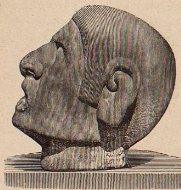
FIG. 28. a

307.—Cabeza humana de dimensiones poco más grandes que el natural. Es una escultura bien modelada.—Procedente del Estado de Veracruz. (Figuras 28. a y 28. a bis.)