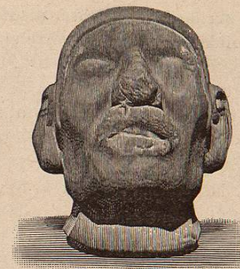
FIG. 28. a BIS.

308.—Cabeza humana de piedra porosa, de dimensión mayor que la natural.—Alt. 0 m 40.