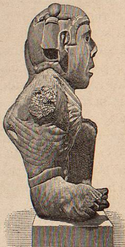
FIG. 27. a BIS.

289.—Figura humana. —Representa á un hombre de cuerpo desproporcionado: se halla en pie, con la cara ligeramente levantada, el brazo izquierdo en semiflexión; en la mano derecha tiene una como pelota en actitud de lanzarla. Sólo tiene ceñidor.—Alt. 0 m 56.