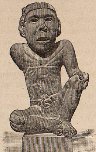
FIG. 27. a

rodillas; carece del brazo derecho, por rotura. (Figuras 27. a y 27. a bis).—Alt. 0 m 37.