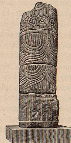
FIG. 25. a

MÉXICO Á TRAVÉS DE LOS SIGLOS. Los dos cilindros superiores están artísticamente decorados en su fuste con plumas, glifos y grecas; (Figura 25. a ) teniendo el mismo carácter de la pilastra 277. La pieza inferior con muy marcados restos de la exornación. Es ejemplar digno de nota.—Altura total del conjunto, 2 m 40. Diámetro aproximado, 0 m 80.