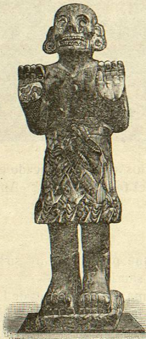
Chicueimiquiztli Mictlancihuatl , con atributos de COATLÍCUE (Diosa de la muerte).

Fué traído de Tehuacán (E. de Puebla). Es de Litomarga.