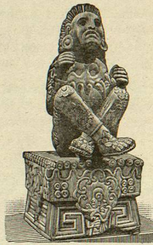
Nahui Ácatl Xochipilli. (DIOS DE LAS FLORES). Traído de Tlalmanalco (E. de México) al Museo.