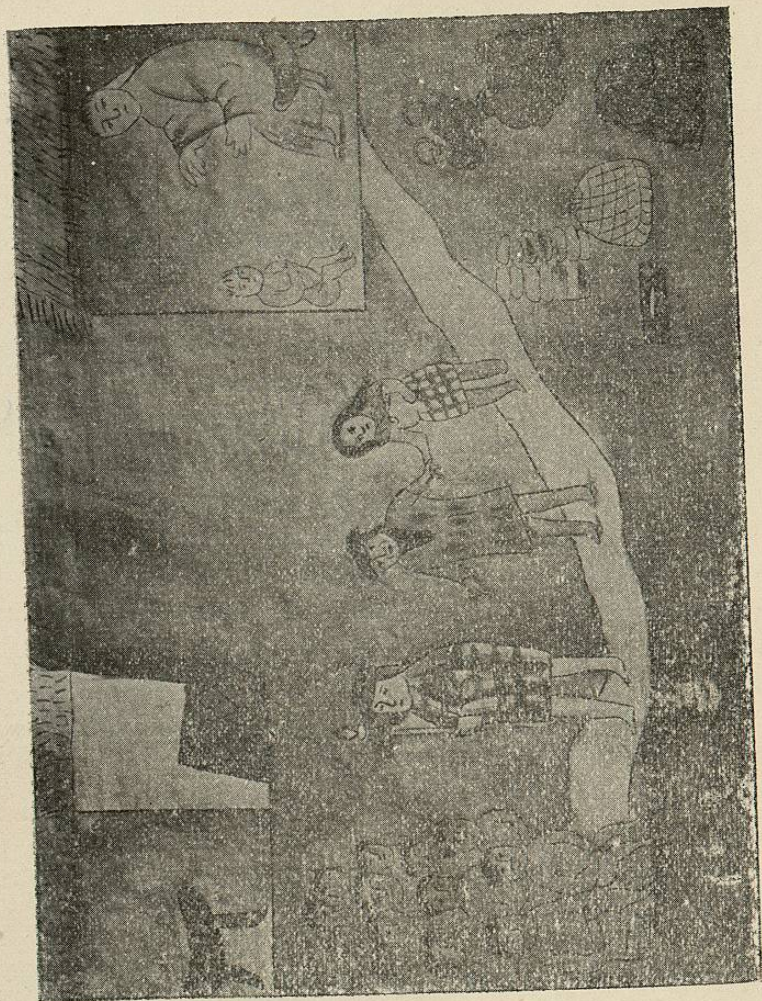
De la manera que se casavan los Señores.

iba con toda la gente por leña para los cues y daba al sacerdote que le habia puesto en el señorío mantas y xicales y guirnaldas de hilo que usaban los sacerdotes y volbíase á la Ciudad de Mechuacan y hacíalo saber al sacerdote mayor como le habia puesto en el señorío y el sacerdote mayor lo hacia saver al cazonci y decia el Cazonci, sea así pruebe á ver si no lo hiciese bien quitaremosle del oficio y probará otro en su lugar á ver como lo hace.