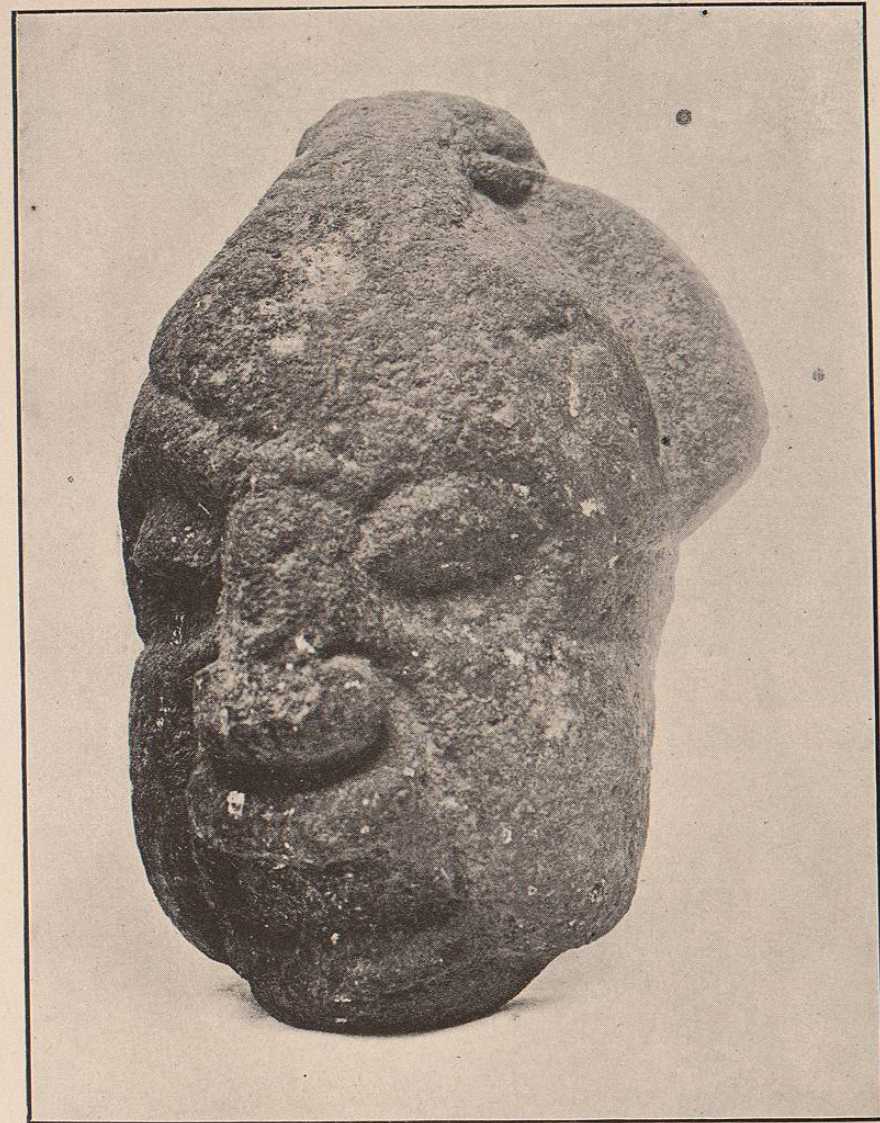
(Lám. 5.) CIVILIZACION TONACACA, Estado de Veracruz.—Cabeza de piedra de basalto, encontrada cerca de la Punta de la Mojarra, ribera Sur del Papaloapam.

Lámina núm. 5. CIVILIZACIÓN TONACACA del Estado de Veracruz.— Cabeza de piedra de basalto encontrada cerca de la Punta de la Mojarra, ribera Sur del Papaloapam.