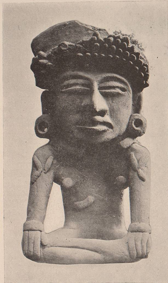
(Lám. 6.) CIVILIZACIÓN TOTONACA, Estado de Veracruz.—Idolo de barro encon- trado en las ruinas de Zempoala.—Colección del Museo Nacional de México.

Lámina núm. 6. CIVILIZACIÓN TOTONACA, Estado de Veracruz.—Ido- lo de barro encontrado en las ruinas de Zempoala.—Colección del Museo Nacional de México.