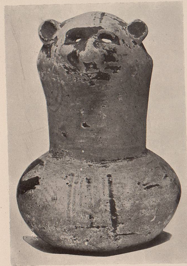
(Lám. 4.)—Frente del jarro representado en la lámina núm. 3.

Lámina núm. 4. Frente del jarro representado en la lámina núm. 3.