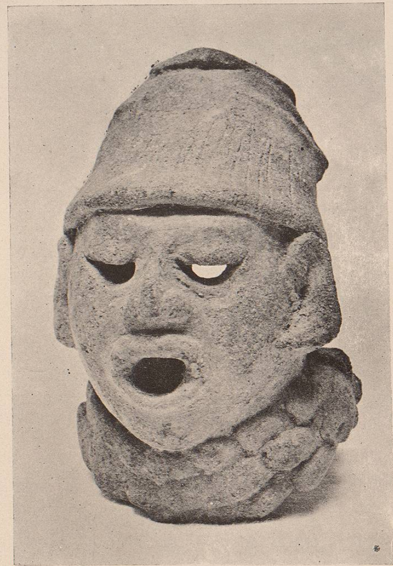
(Lám. 7.) CIVILIZACION TONACA.—Cabeza de barro cocido encontrada en Alvarado, Estado de Veracruz.

Lámina núm. 7. CIVILIZACIÓN TONACA.—Cabeza de barro cocido en- contrada en Alvarado, Estado de Veracruz.