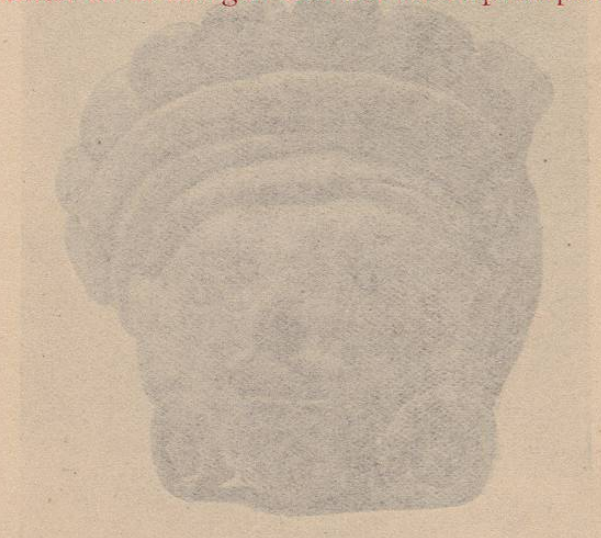
(Lám. 9) Fig. 1.—CIVILIZACION TOTONACA.—Cabeza de barro cocido: representa la cabeza de un tigre. Encontrada en la Hacienda de San Francisco, jurisdicción de Alvarado.— Colección del Sr. Aristides Martel. Fig. 2.—CIVILIZACION TOTONACA.—Cabeza de barro cocido encontrada en la margen Sur del río Papaloapam.