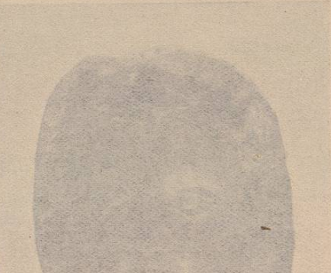
Lámina núm. 8.

Fig. 1.—CIVILIZACIÓN TOTONACA. —Molde de barro cocido encontrado en el camino que conduce de Veracruz á Alvarado.