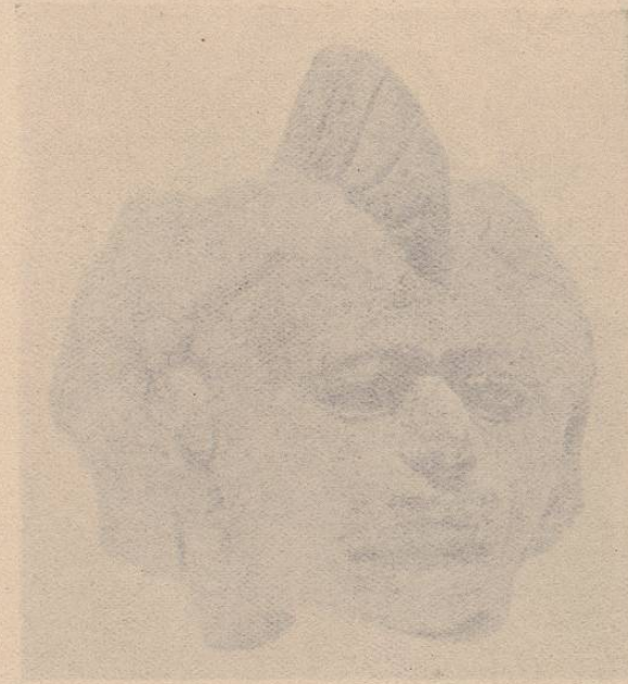
(Lám. 8.) Fig. 1.—CIVILIZACION TOTONACA.—Molde de barro cocido encontrado en el camino que conduce de Veracruz á Alvarado. Fig. 2.—CIVILIZACION TOTONACA.—Cabeza de barro encontrada cerca de la playa sur de Alvarado, Estado de Veracruz.

Fig. 2.—CIVILIZACION TOTONACA. —Cabeza de barro encontrada cerca de la playa Sur de Alvarado, Estado de Veracruz.