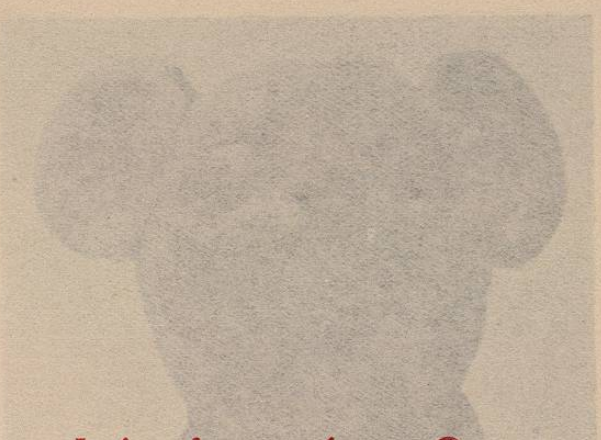
Fig. 2.—CIVILIZACION TOTONACA. —Cabeza de barro cocido encontrada en la margen Sur del río Papaloapam.

Fig. 1.—CIVILIZACION TOTONACA. —Cabeza de barro cocido: representa la cabeza de un tigre. Encontrada en la Hacienda de San Francisco, jurisdicción de Alvarado.— Colección del Sr. Aristides Martel.