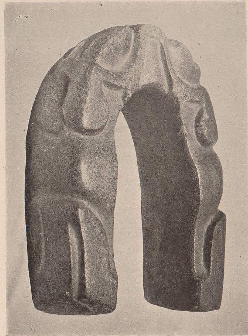
(Lám. 58.) CIVILIZACION NAHUA.—Yugo de piedra de granito gris, perfectamente pulida, encontrado cerca del Juil, Estado de Veracruz.

Lámina núm. 58. CIVILIZACION NAHUA.—Yugo de piedra de granito gris, perfectamente pulida, encontrado cerca del Juil, Estado de Ve- racruz.