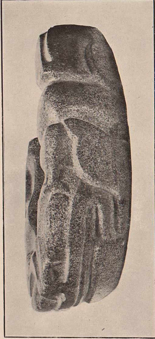
(Lám. 57.) CIVILIZACION NAHUA.—Yugo de piedra de granito gris perfectamente pulida, empleado en los sacrificios humanos, colocándolo en el cuello de las víctimas.—Esta pieza está esculpida en forma de sapo ó rana.—Fue encontrada en el Julí, sobre el camino de fierro del Pacífico, en el Estado de Veracruz.