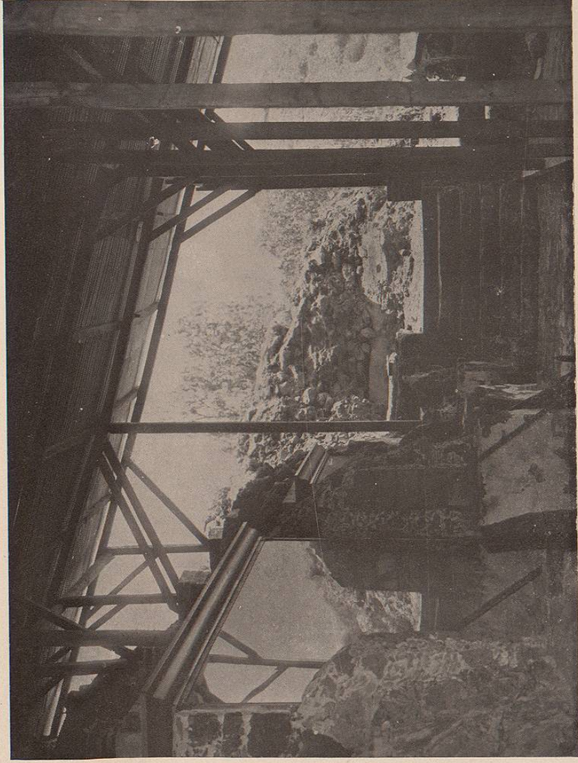
(Lám. 21.) TEOTIHUACÁN.—Templo de la agricultura. Costados Norte y Este.

TEOTIHUACÁN.—Templo de la agricultura. Costado Norte y Este. Norte y Este con una pequeña escalera en que se descubrieron los grandes tableros murales pintados al fresco, representando frutas y flores, atributos de la agricultura. Hoy se encuentran perfectamente resguardados debajo de grandes cristales, asegurados con fuerte encuadradura de hierro. Se ve en el grabado el reflejo de los cristales.