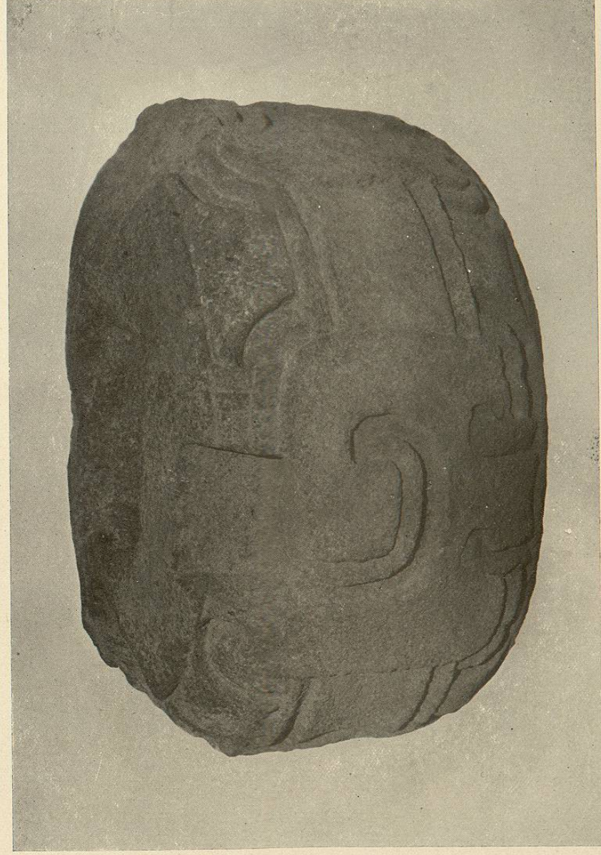
(Lám. 23.) TEOTIHUACÁN.—Pieza de piedra de granito con una oquedad en el centro.

los. te descubiertos en la acera Este de la llamada calle de los Muertos descubierta en uno de los templos recientemente de diámetro. Fue encontrada en la civilización tolteca de Papantla. Mide 70 centímetros los de la civilización tolteca de Papantla. Mide 70 centímetros de espesor. Los relieves son del mismo carácter que macizo, quedando separadas por un peduño lapide de tres vando las perforaciones la misma dirección en el corazón del oquedad en el centro, practicada en las dos caras de la piedra, lla- Lámina núm. 23. TEOTIHUACÁN.—Pieza de piedra de granito con una