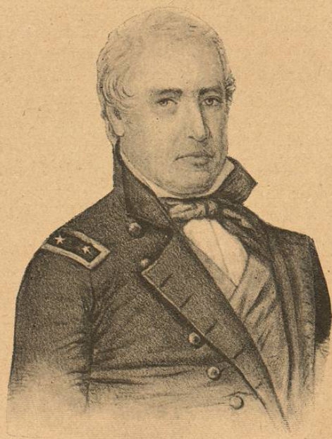
General Taylor, Jefe norteamericano del Ejército de Operaciones del Norte de la República Mexicana.