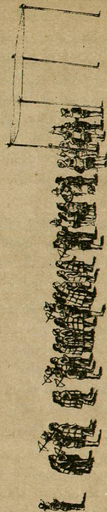
HERNÁN CORTÉS, subido sobre la azotea de la casa de un noble llamado Aztaoatzin , recibe á Cuauhtemoc ya preso, acompañado del señor de Tacuba , si nobles y dos guerreros que venían con él en la canoa adonde fué aprehendido. Presentan al real prisionero los capitanes españoles Sandoval y Holguito .

79. Desde la azotea de este palacio estuvo Cor-