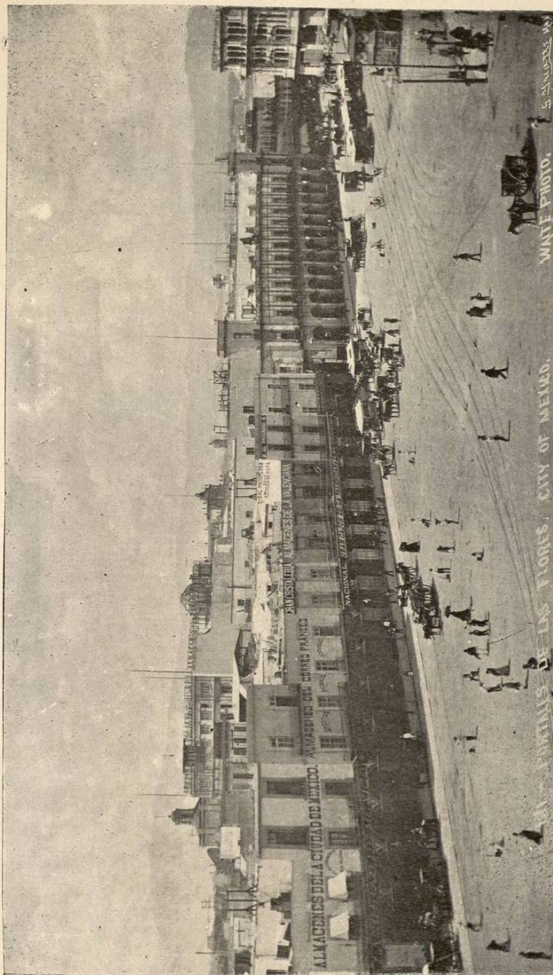
Vista de la parte Sur de la Plaza Mayor ó de la Constitución. A la derecha se observa el Palacio Municipal.