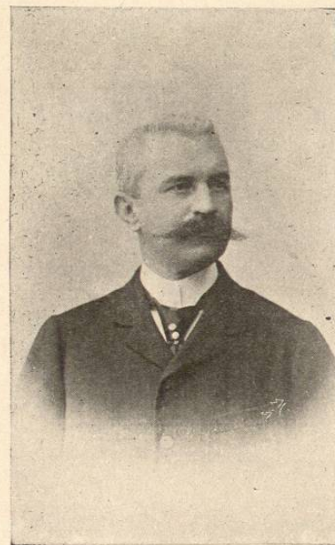
SR. D. RAMON CORRAL, Gobernador del Distrito Federal.