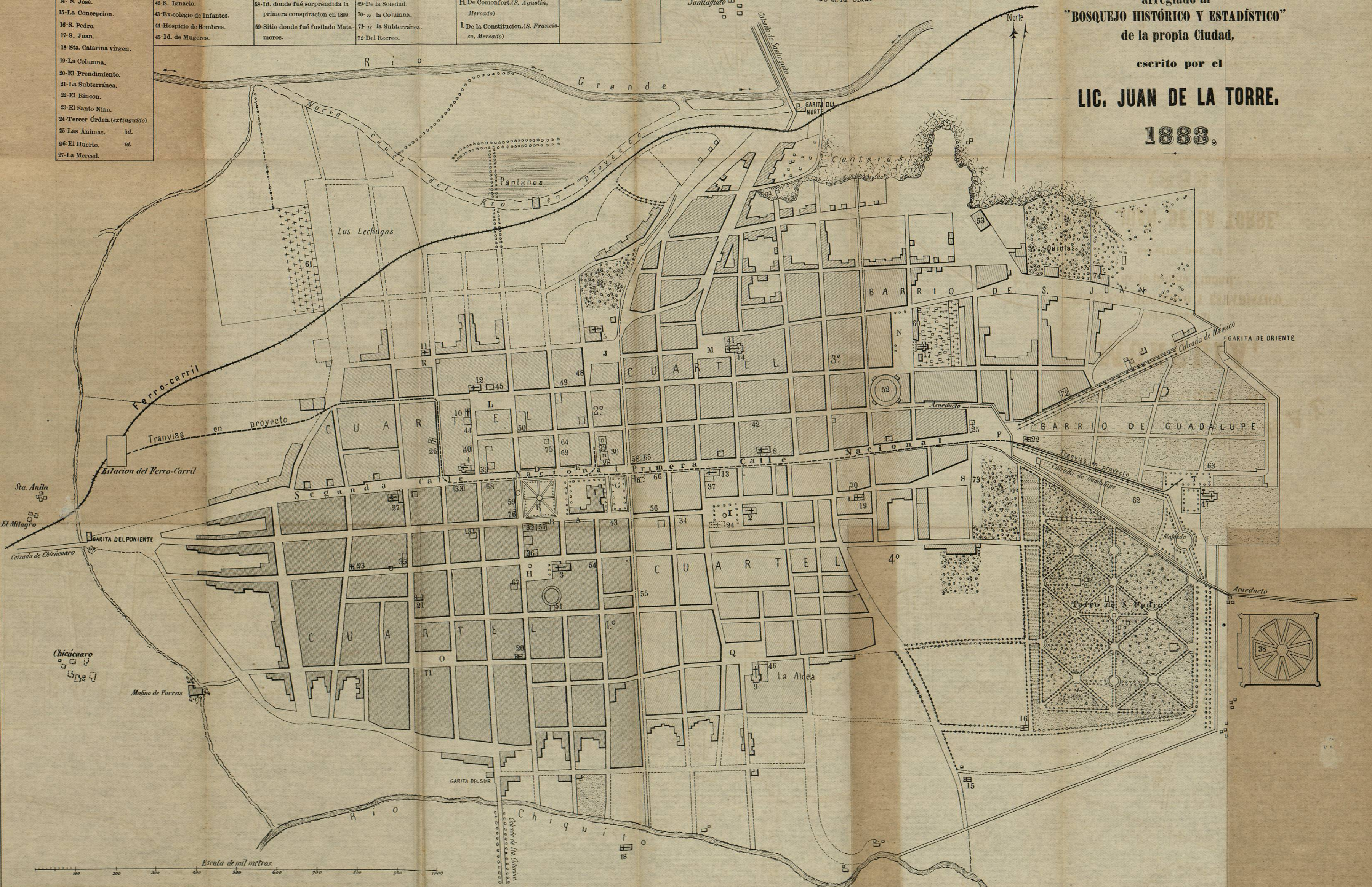
Escala de mil metros.