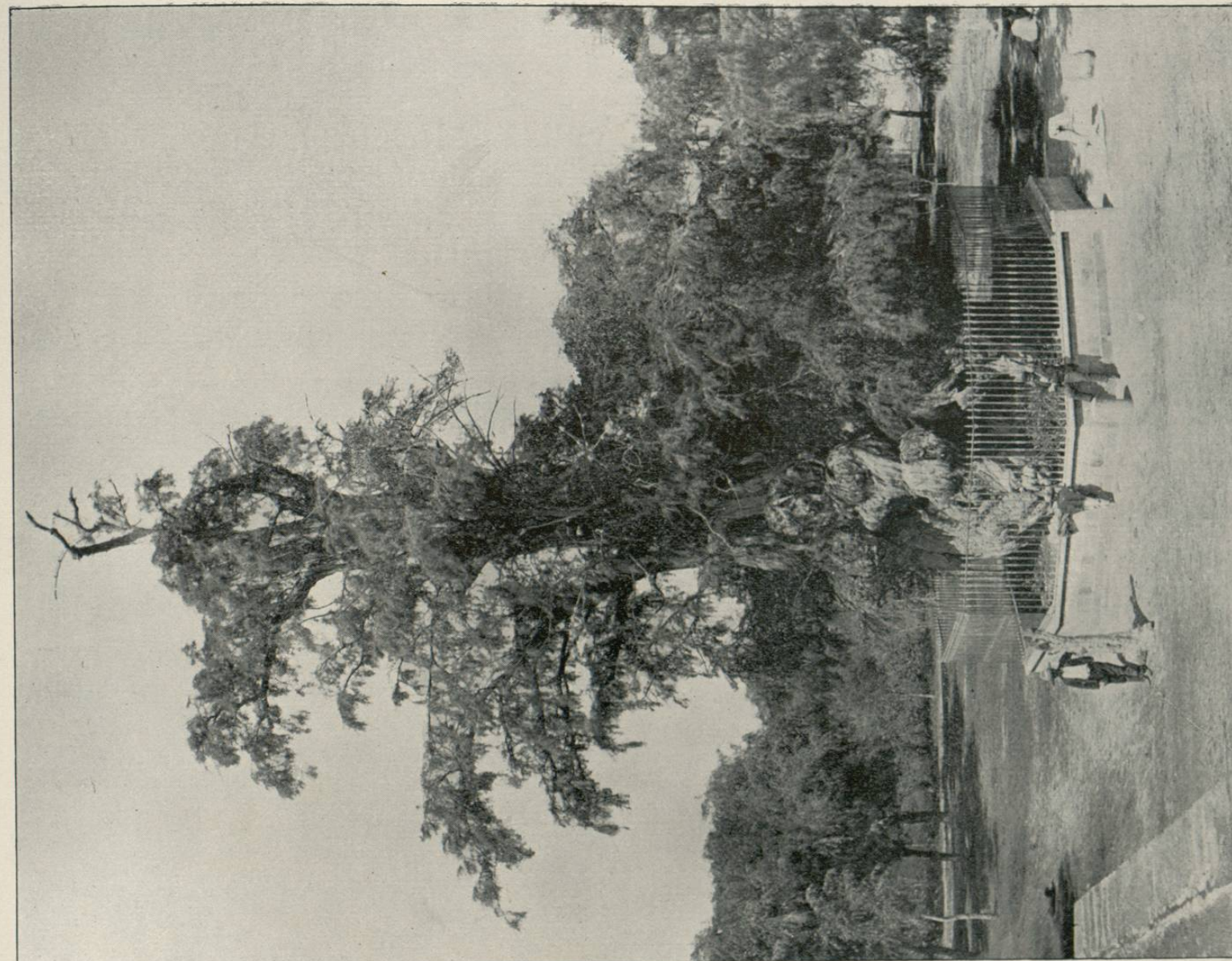
TREE OF THE SORROWFUL NIGHT, NEAR CITY OF MEXICO.

Por los años de 1872 á 1873, una mano tan criminal como fanática intentó por medio del fuego destruir esta reliquia histórica sin conseguir su objeto, pues el árbol aún se conserva. La indignacion que esta maldad produjo, fué general en el país; y desde entonces ese anciano de la vegetacion está resguardado por una verja de hierro y por la vigilancia de la policía.