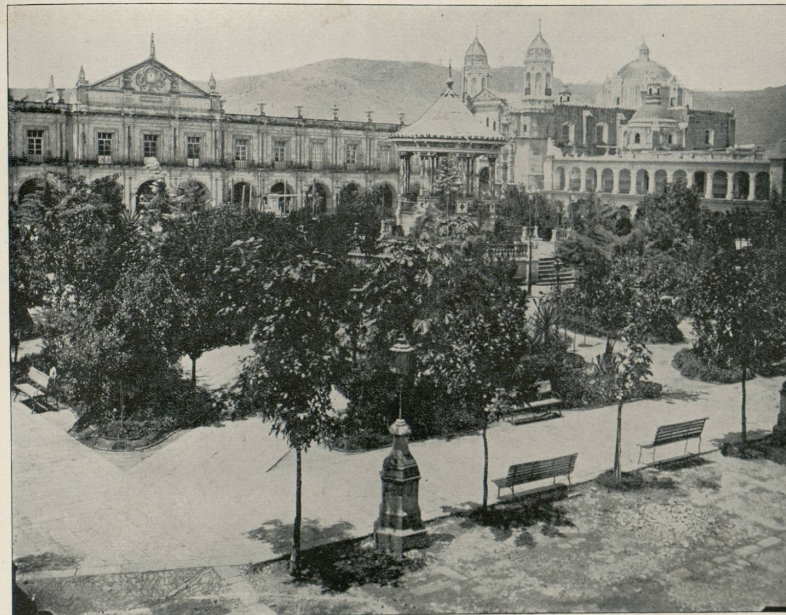
PUBLIC SQUARE IN OAXACA, MEXICO.

Para presentar un modelo de jardín público, que pueda dar una idea del estilo peculiar, característico del país, dominante en todos sus sitios de recreo del mismo género, hemos elegido el de Oaxaca, de éste Estado que tan importante papel representa en las titánicas luchas por que la gran República de Juárez ha tenido que atravesar para llegar á su ideal de libertad y de reforma, porque estando la mencionada ciudad alejada de la red ferrocarrilera, extendida en la mayor parte del territorio mexicano durante los últimos quince años, es poco visitada por los turistas extranjeros y por una gran parte de los nacionales. De esta manere nuestro fotograbado reúne al atractivo natural de lo bello, el interés de lo desconocido.