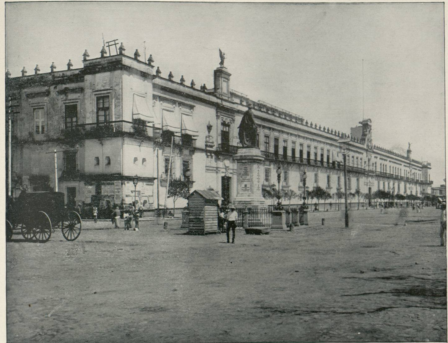
NATIONAL PALACE, CITY OF MEXICO, MEXICO.—The National Palace was originally the Viceregal residence. It has a frontage of six hundred and seventy-five feet, and contains most of the Government offices (ministerial, cabinet, treasury), military headquarters, archives, meteorological department with observatory, and the spacious hall of ambassadors, with some remarkable paintings by Miranda and native artists. North of the palace, and apparently forming portions of it, are the post-office and the national museum of natural history and antiquities, with a priceless collection of Mexican remains. The palace is a very imposing structure, and one of the most famous buildings in the city.

Este importante monumento, que el vulgo llama "El Nivel," fué levantado en el primer período del gobierno del Sr. Gral. Don Porfirio Díaz, y con su erección la ciudad de México ha satisfecho una deuda de gratitud hacia el ingeniero al cual se debe el asombroso tajo de Nochistongo.