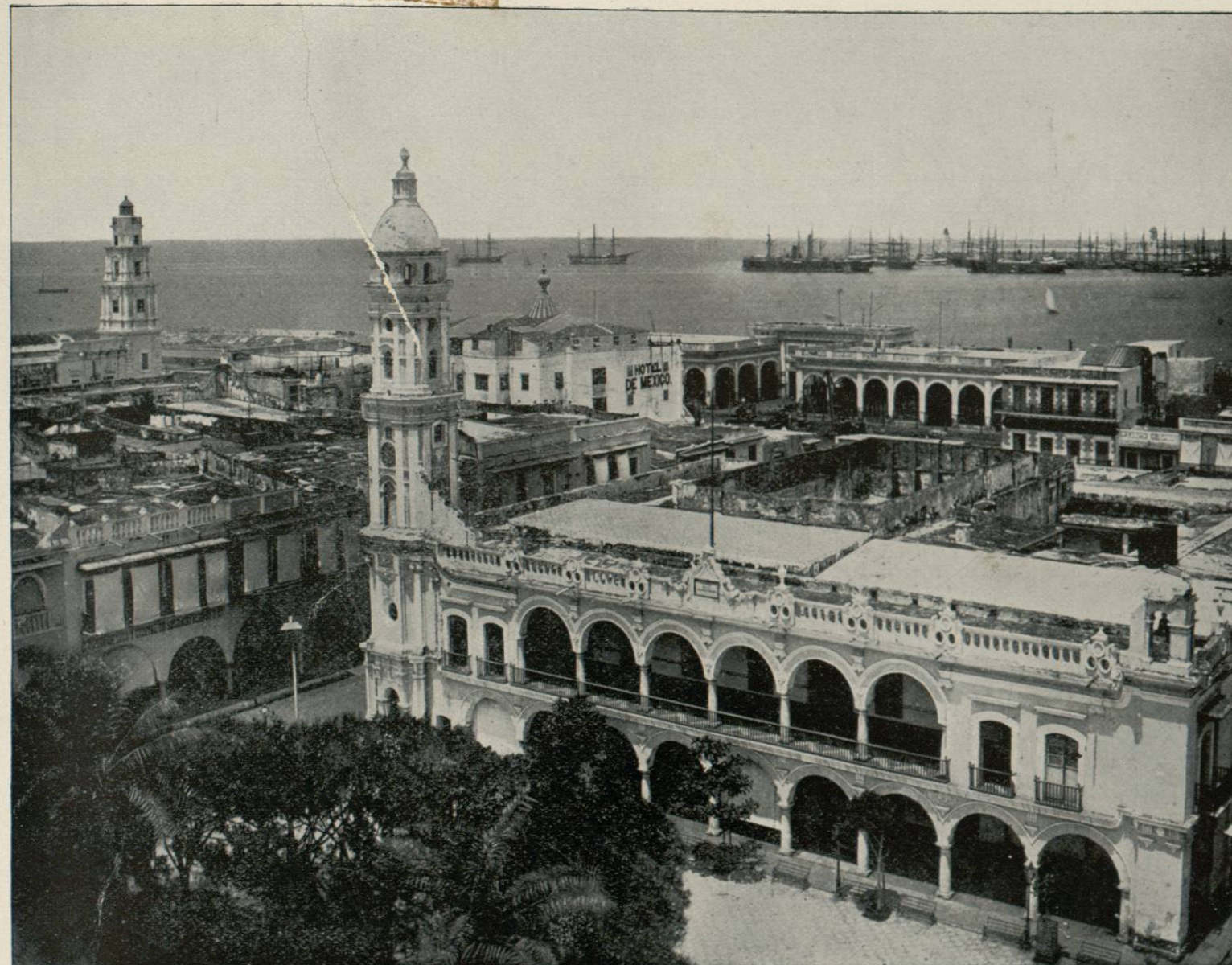
PORT OF VERA CRUZ, MEXICO.

Veracruz es el primer puerto de la República Mexicana por su movimiento comercial; y la ciudad lleva el nombre de "Heróica," desde que fué el refugio seguro del Gobierno liberal. Así como del Sináí, entre relámpagos y truenos, salieron las Tablas de la Ley para llenar el mundo, de Veracruz salieron entre disparos de cañon y vítores de patriotismo, los primeros "Leyes de Reforma," los primeros de ese luminoso conjunto de mandatos, que más tarde debían ser el complemento de la Carta Magna del país constituído en la libertad, en la civilizacion y en el progreso.