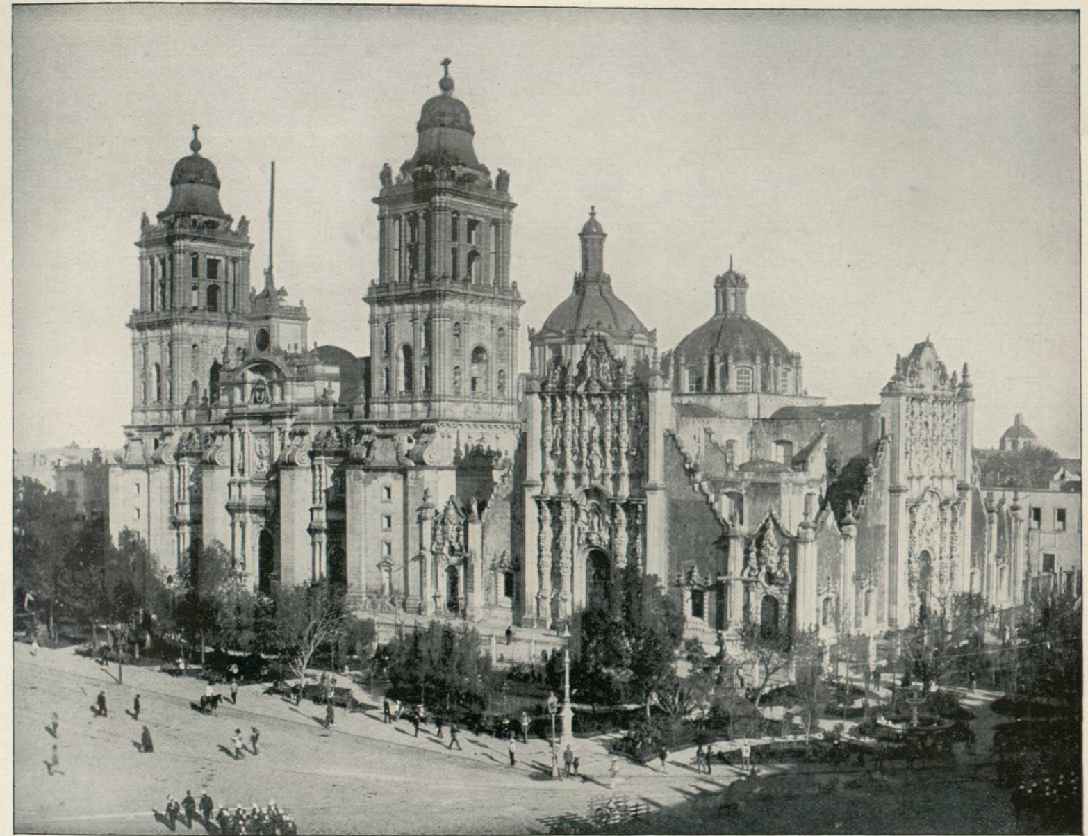
THE CATHEDRAL, CITY OF MEXICO, MEXICO.—The Cathedral is the largest and most sumptuous church in America. It faces the north side of the plaza, on the side of the great pyramidal teocalli or temple of Huitzilopochtli, titular god of the Aztecs. This edifice, which was founded in 1573 and finished in 1657, at a cost of $2,000,000 for the walls alone, forms a Greek cross, 426 feet long and 203 wide, with two great naves and three aisles, twenty side chapels and a magnificent high altar, supported by marble columns and surrounded by a tumbago balustrade, with sixty-two statues of marble, rich gold, silver and copper alloy serving as candelabra.