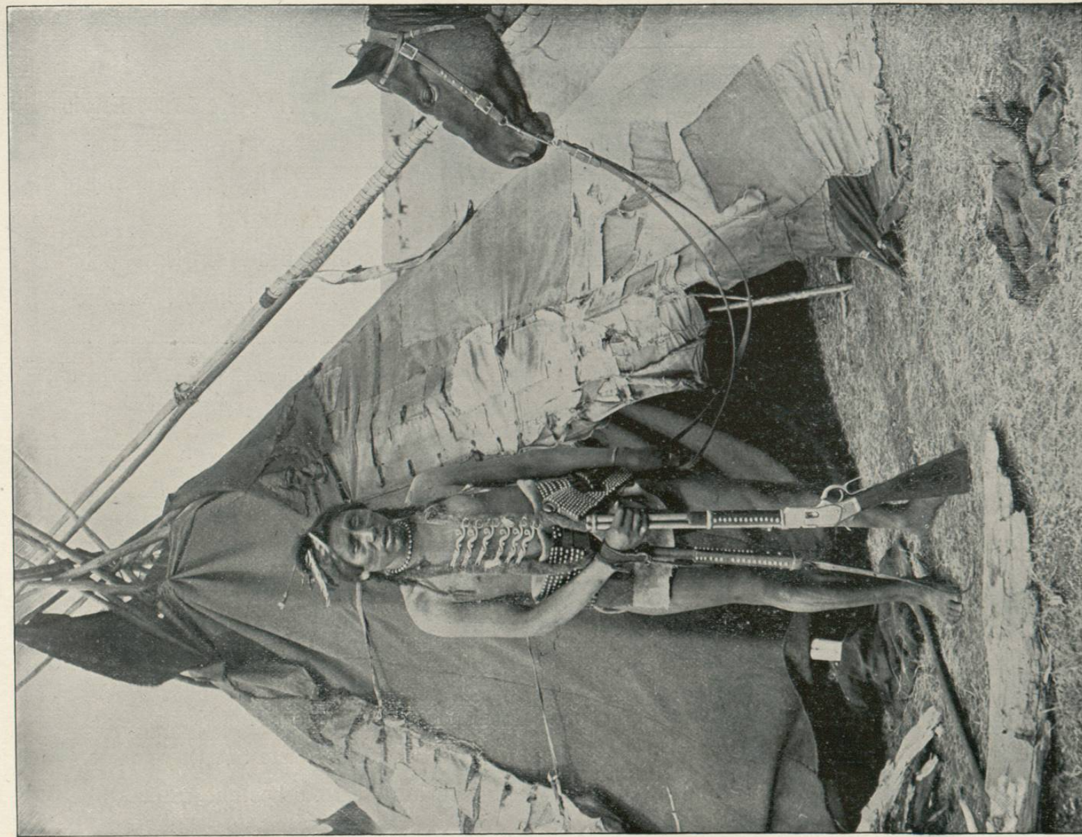
INDIAN WIGWAM, INDIAN TERRITORY.—The red man, the original inhabitant of American soil, is represented here at his hut, with his gun and the reins of his horse in his hands. He has a universal belief in a Supreme Being, though his religious attributes are associated with various manifestations of natural phenomena. He believes in the immortality of the soul, but his conceptions of the future system of reward and punishment are confused. The American Indians are slowly diminishing in number on account of the progress of the white man. Their present population is about 255,000, and the greatest number are gathered upon their reservations in Indian Territory.

TENEMOS aquí representado á un individuo, miembro de la raza de las pieles rojas, los primitivos habitantes del suelo americano. Se nos presenta próximo á su tienda de campaña, con su rifle, arma moderna que ha reemplazado á las primitivas de arco y flecha y á la macana, en la mano derecha y en la otra las riendas de su caballo, el cual asoma la cabeza, que basta ver para conocer que pertenece á esa raza de animales tan degenerada, pero á la vez tan sufrida, que ha llegado á asimilarse con el salvaje de una manera prodigiosa. El indio cree en un Ser Supremo, aunque con frecuencia lo asocia con los fenómenos de la naturaleza; cree en la inmortalidad del alma, pero son algo vagas sus ideas sobre el premio y el castigo que se le deparan al mortal en la otra vida. Los indios americanos van desapareciendo rápidamente, dejando el campo libre al hombre blanco más enérgico y más emprendedor, y hoy solamente quedan 225,000 indios, que en su mayor parte están reunidos en sus reservaciones en el Territorio Indio.