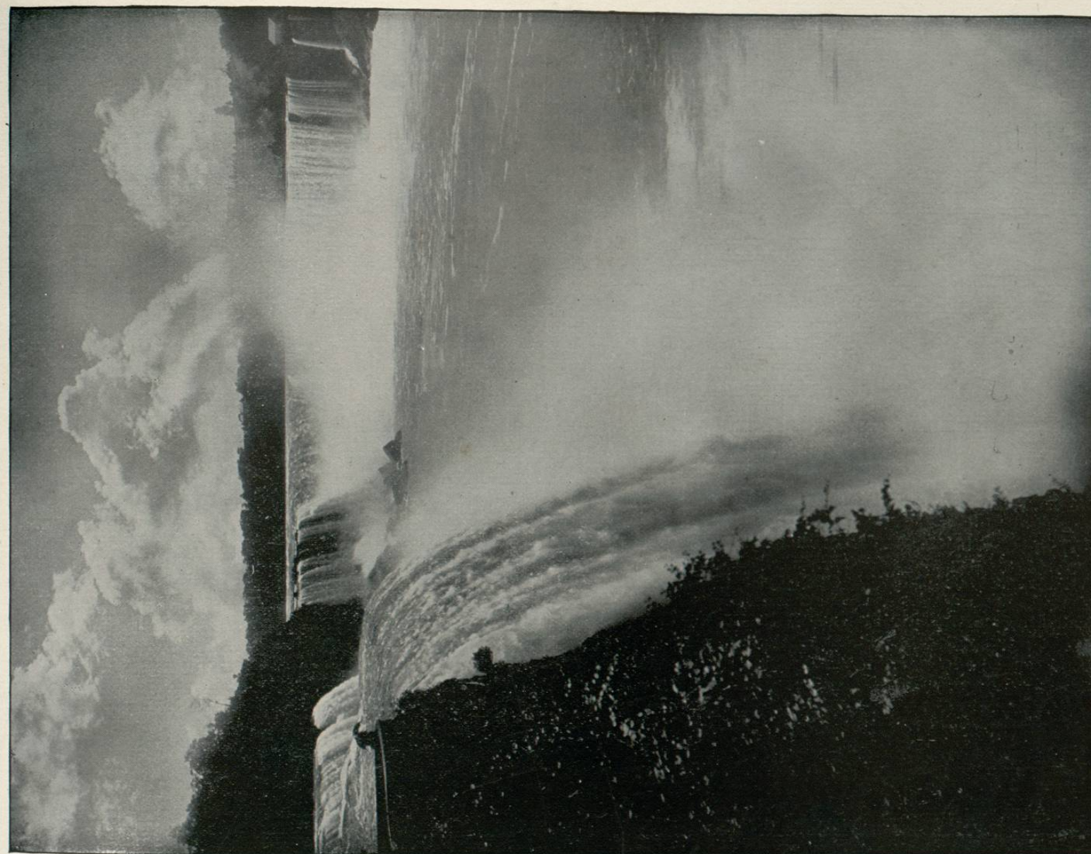
NIAGARA FALLS, NEW YORK.—The above falls constitute perhaps the most striking natural wonder in the world. Above the falls, the river is divided by Goat Island, forming the Horseshoe Falls, with a perpendicular descent of one hundred and fifty-eight feet. The height of the American Falls is one hundred and sixty-seven feet. Below the cataract, the river is very deep and narrow, varying from one hundred to three hundred yards, and flows between perpendicular rocks, two hundred and fifty feet high, into a gorge, which is crossed by several suspension bridges. These falls are world-famed, and are visited by thousands of tourists from different parts of the world.

¿QUIÉN NO conoce ó no ha oído hablar siquiera de este prodigio de la naturaleza? Estas cascadas constituyen talvez la maravilla más portentosa que presenta la naturaleza en el mundo entero. Arriba de las cascadas el río está dividido por el islote llamado Goat Island, formando las Caídas de Herradura de Caballo, con un descenso perpendicular de ciento cincuenta y ocho piés. La altura de las cascadas americanas es de ciento sesenta y siete piés. Abajo de la catarata el río es muy profundo y angosto, mide de cien á trescientas yardas, y corre por entre rocas de corte perpendicular que se elevan á doscientos cincuenta piés de altura, hasta vaciarse en una garganta que se atraviesa por medio de varios puentes colgantes. Como hemos dicho, estas cascadas tienen fama universal y las visitan continuamente miles de viajeros que acuden de todas partes del mundo á contemplar esa maravilla.