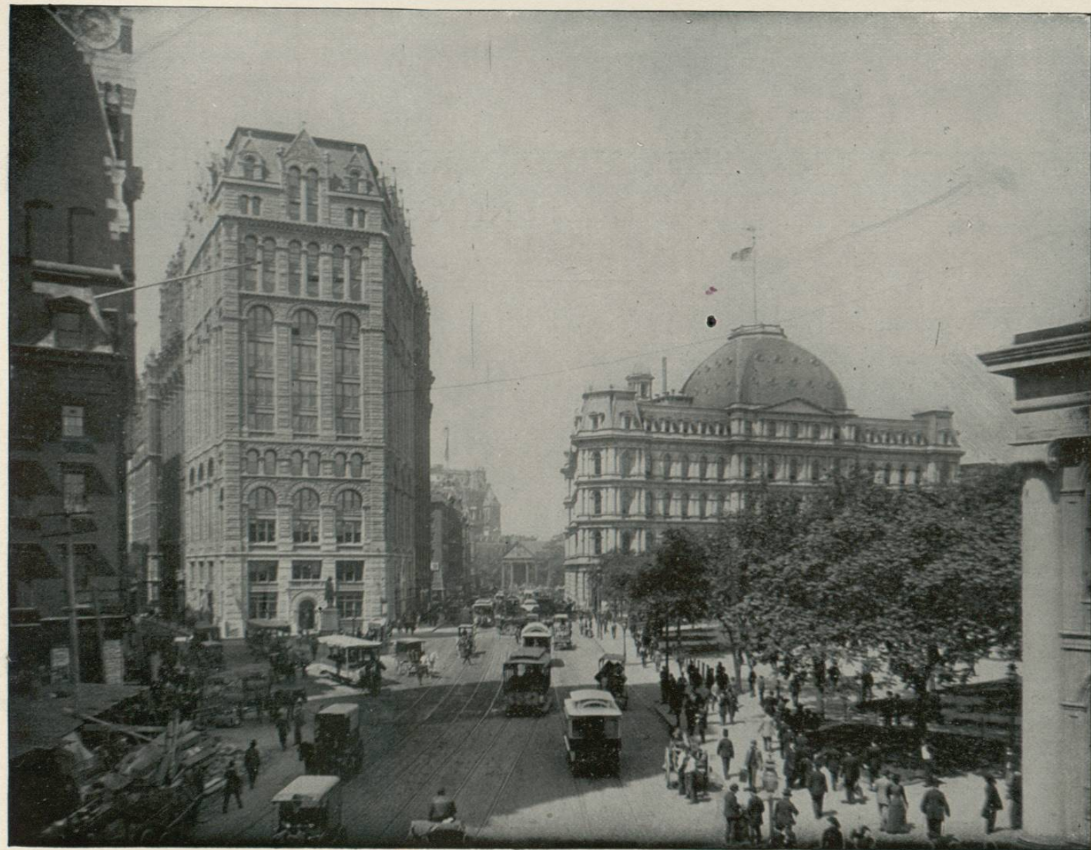
PARK ROW, NEW YORK CITY, N. Y.—The metropolis of the United States, is considered the headquarters of the stock and money market. It is here where the greater number of foreign vessels land and depart, and where the majority of immigrants first step upon our shores. The city is built on Manhattan Island, which is 13 miles long, and from 2 to 4 miles wide. This picture represents Park Row, and the New York Times' Building in the front and the general Post Office on the right, which is a large granite structure, and an ornament to the city. New York has a population of nearly two million people, composed of all nationalities. This city gives to the student of human nature an excellent opportunity to observe the life and habits of the different nations.

LA METROPÓLI de los Estados Unidos es el centro de las finanzas, de las grandes operaciones de bolsa y del mercado monetario, habiendo adquirido en este respecto una importancia que solamente tienen las más grandes capitales europeas. En esta gran ciudad es donde entra y sale el mayor número de buques, y donde la gran mayoría de inmigrantes pisan por primera vez nuestras playas. La ciudad, propiamente dicha, está construída en una isla que se denomina Manhattan Island, la cual tiene 13 millas de longitud y de 2 á 4 de anchura. Nuestra fotografía representa el punto conocido con el nombre de Park Row, á cuyo frente aparece el edificio del "Times" de Nueva York; á la derecha se ve la Oficina General de Correos, hermoso edificio de granito que constituye un verdadero y magnífico ornamento para la ciudad. Nueva York tiene muy cerca de dos millones de habitantes, y entre éstos se cuentan representantes de todas las nacionalidades. Esta ciudad proporciona al aficionado á hacer estudios de la naturaleza humana magníficas oportunidades de observar la vida y las costumbres de los diferentes pueblos de la tierra, que, como hemos dicho, están en ella representados.