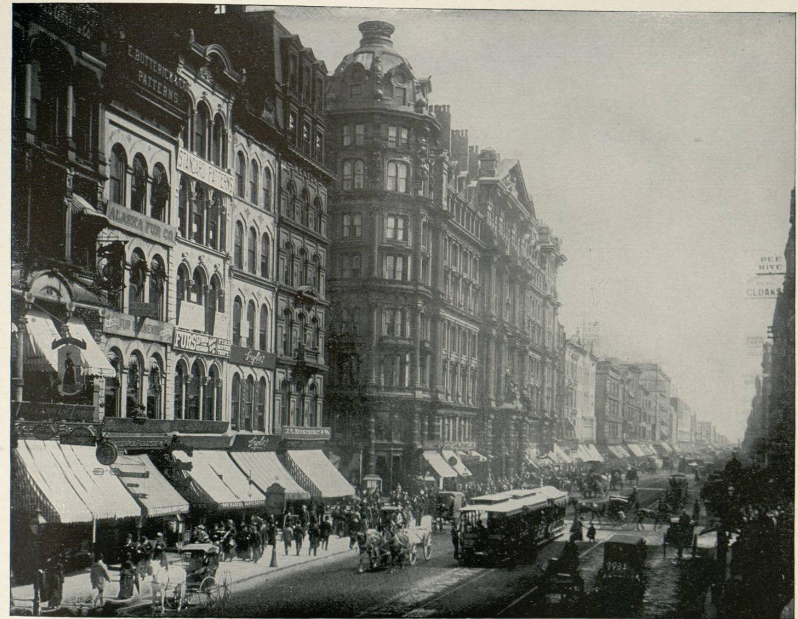
STATE STREET, CHICAGO, ILLINOIS.—This city, which is now the most important centre of commerce in the Northwestern States, is situated at the mouth of the Chicago River, on Lake Michigan. The first inhabitants known to have been in the locality were the Pollowatomie Indians, and the earliest Europeans were French fur traders, who visited the site in 1654. Fort Dearborn was built in 1804, when the first attempt was made to settle here; but the Indians destroyed and massacred most of the garrison in 1812. In 1816 the place was rebuilt and to-day stands as one of the leading cities of America. The above represents State Street, one of the principal thoroughfares, and the Palmer House, one of its leading hotels.