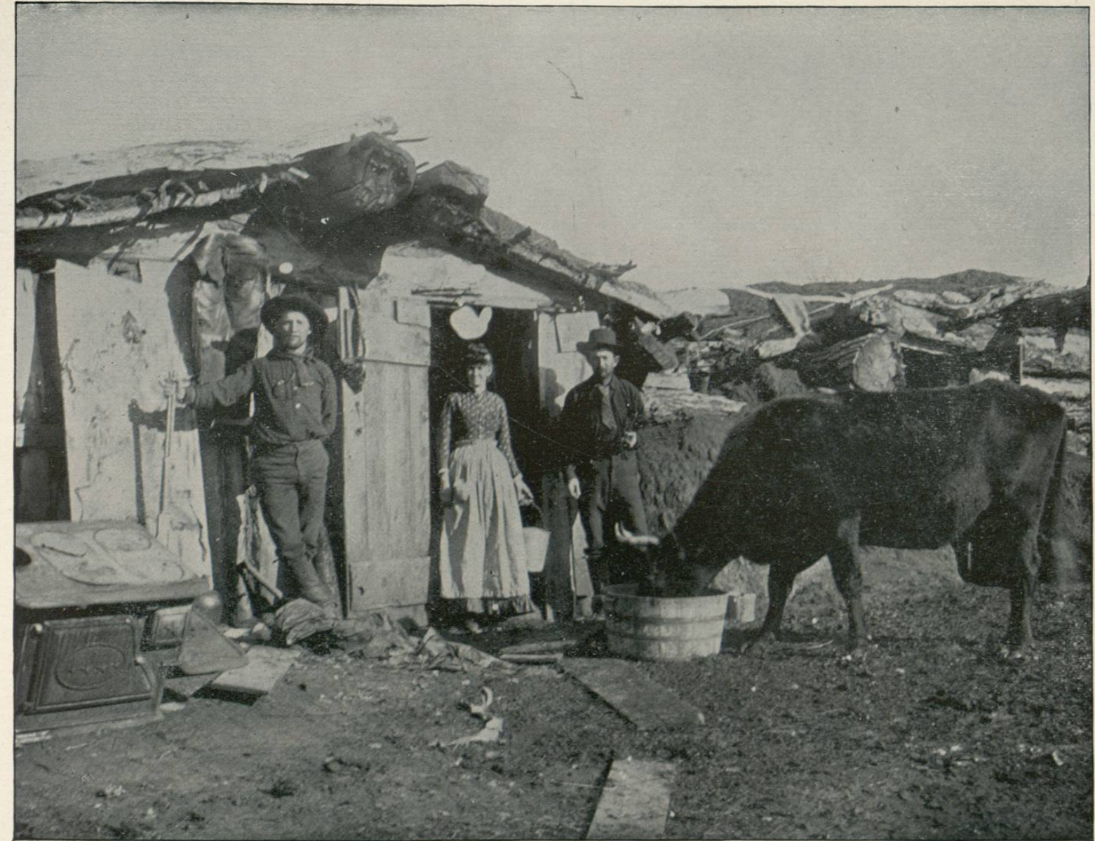
LIFE IN OKLAHOMA, OKLAHOMA TERRITORY.—Oklahoma Territory is a beautiful stretch of country, abounding in vast and fertile plains. In the eastern part, the soil is particularly rich and well irrigated, making it almost as productive as a garden. The territory was formerly the special domain for all the Indian tribes, but this original race seems to be gradually becoming extinct. The above photograph represents a scene in Oklahoma County. This county is nearly in the centre of the territory, on the line of a railroad which has recently been opened. Owing to its admirable adaptability for agriculture, it is fast becoming populated. The picture suggests the most primitive rural simplicity.

E L TERRITORIO de Oklahoma constituye un hermoso país, abundantísimo en vastos y fértiles llanos. Especialmente en la parte oriental el suelo es feracísimo, y como se ha cuidado de atender al pormenor de dotar á los campos de los medios necesarios para regarlos perfectamente, parecen aquellos verdaderos jardines. El territorio era antes la zona especialmente destinada á todas las tribus de indios, pero éstos han ido desapareciendo, dejando el campo á la civilizacion, y las razas de indígenas parecen estar ya á punto de extinguirse. Nuestra vista fotográfica representa una ranchería en el Condado de Oklahoma. Este condado está casi en el centro del territorio, y por él atraviesa una vía férrea que se acaba de construir y abrir al tráfico; debido á que el país es muy propio para la agricultura se está poblando con increíble rapidez. La ranchería no puede presentar un aspecto más simple y primitivo, y revela desde luego al colono emprendedor que, afrontando toda clase riesgos y privaciones, ha ido poco á poco invadiendo territorios que hoy constituyen las más ricas regiones de la Gran República Americana.