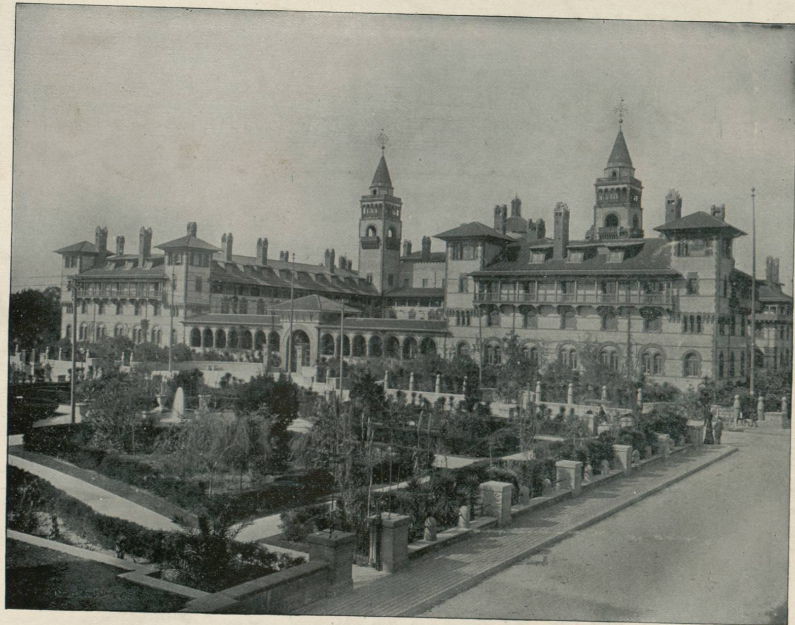
PONCE DE LEON, ST. AUGUSTINE, FLORIDA.

EL EXCELENTE clima que se disfruta en este Estado, durante los meses en que en otras partes de los Estados Unidos la temperatura es inaguantable, hace que sea muy grande el número de personas que buscan en sus playas el placer y la comodidad que pueden procurarse con su dinero. Nuestra vista fotográfica representa el Ponce de Leon, hermoso hotel construido especialmente para esta clase de viajeros: reúne dicho establecimiento cuantas comodidades pueden exigirse, y no es extraño por eso que sea grandemente frecuentado. De construcción sólida y elegante á la vez, no se ha omitido en este hotel gasto ninguno para hacerlo, como quizá es, el mejor de su clase en los Estados Unidos, no obstante del gran número de buenos establecimientos que para conveniencia del público viajero existen en toda la Gran República. Sin necesidad de entrar en pormenores, que no sería posible dar en el pequeño espacio de que disponemos, basta ver la excelente fotografía para formarse una idea del Ponce de Leon y comprender que no exageramos en nuestras calificaciones.