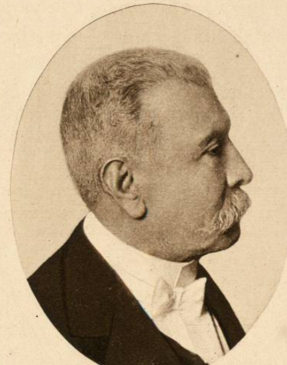
GRAL. D. PORFIRIO DÍAZ, PRESIDENTE.