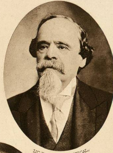
LIC. D. IGNACIO MARISCAL, MINISTRO DE RELACIONES EXTERIORES.

La Historia, en letras de oro escrito, transmitirá vuestro nombre á la posteridad.