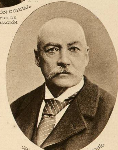
GRAL. D. MANUEL GONZÁLEZ COSÍO, MINISTRO DE FOMENTO COLONIZACIÓN É INDUSTRIA.