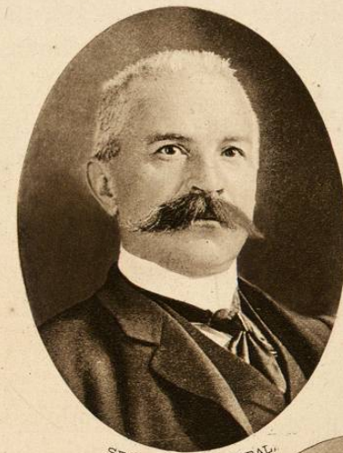
SR. D. RAMÓN CORRAL, MINISTRO DE GOBERNACIÓN.