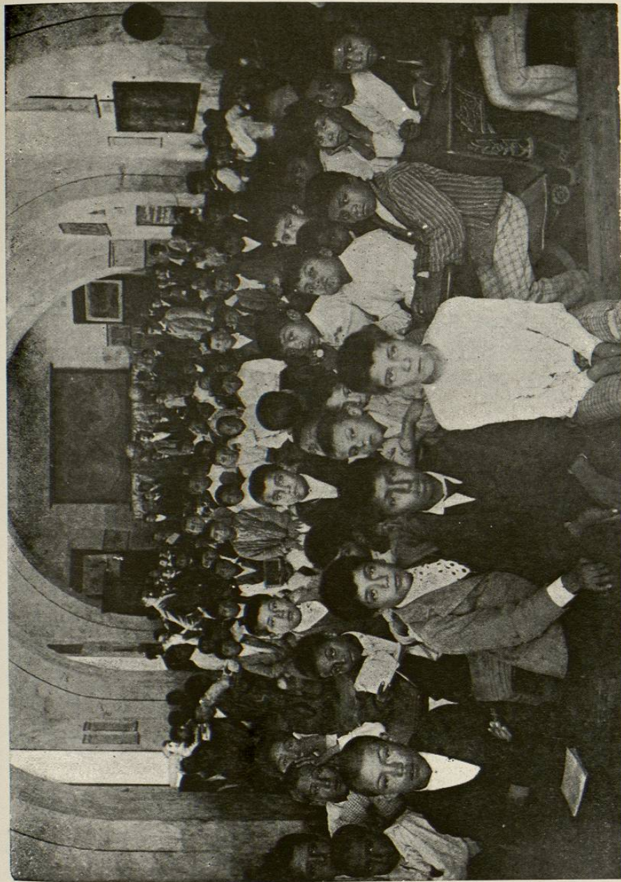
Tip. y Lit. "La Europea."

Con fecha 17 de Febrero de ese año aprobó la Legislatura el Reglamento de la ley número 46 sobre instrucción primaria.