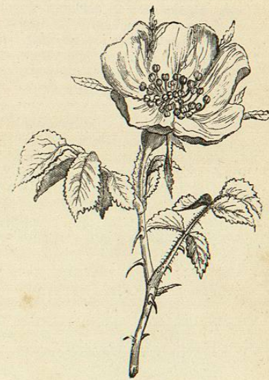
ROSAL DE OLOR DE MANZANO. ( Rosa rubiginosa ).