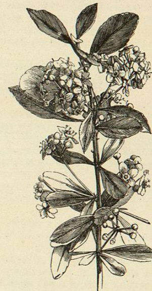
CELASTRO DE HOJAS DE BOJ. ( Celastrus luxifolia ).