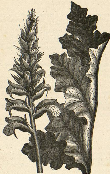
ACANTO SIN ESPINAS. ( Acanthus mollis ).

El tabaco es una planta de primera importancia por el uso general que se hace de ella en todos los países del globo. Los españoles que acompañaron á Colon y llegaron á Cuba con él en 1492, vieron con sorpresa á los indígenas arrollar las hojas secas de esta planta, formando un tubo que llamaban tabaco , encender una de sus puntas metiéndose la otra en la boca, y por