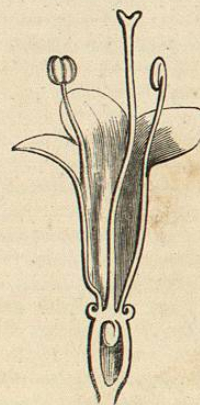
VALERIANA. (Flor cortada verticalmente).