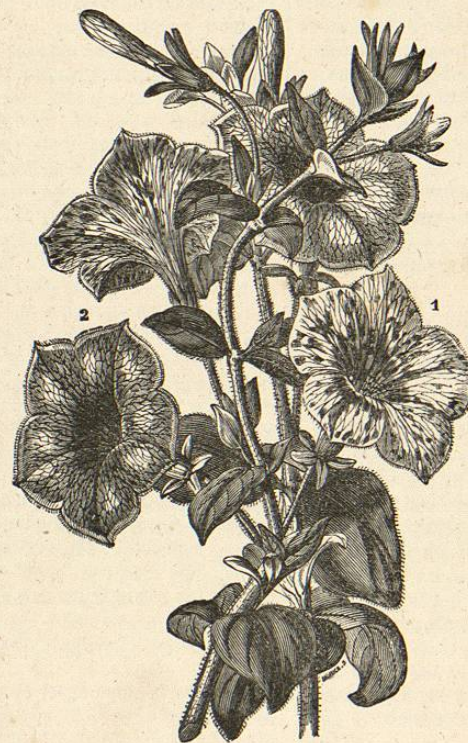
1. PETUNIA PINTADA. 2. PETUNIA DE VAN VOLXEM. ( Petunia melcagris ). ( Petunia Van Volxem ).