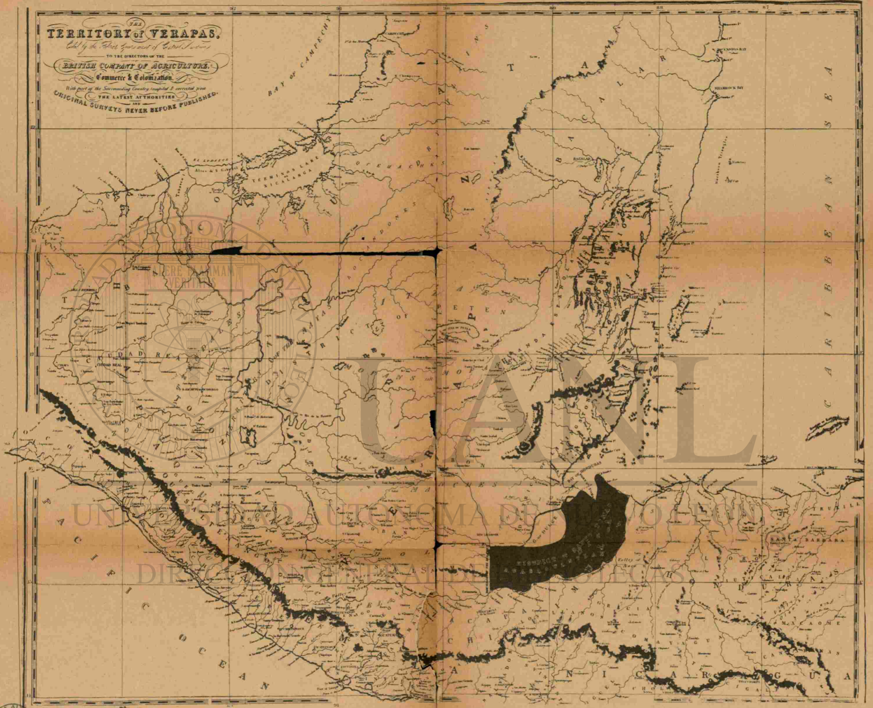
1839.—Mapa de la British Col. Co.

Mapa de la "British Company of Agriculture, Commerce & Colonization". La compañía inglesa de tal nombre había obtenido del gobierno de Guatemala la concesión para colonizar en la costa norte. Dicha compañía hizo levantar un mapa en el que, en negro, se marca la zona de la concesión. Este mapa, hecho por ingleses, protegiendo intereses ingleses, demuestra que en 1839 el territorio de Belice se mantenía hasta el río Sibún, y no más al sur, no obstante la conquista que dice el gobierno inglés haber hecho del territorio, del río Sibún al río Sarstún.