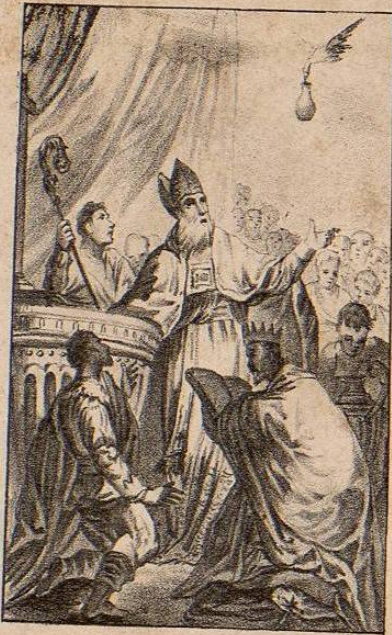
S. Remigio Obispo.