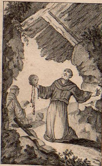
S. Francisco de Asis.