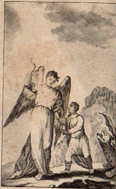
Los Santos Angeles Custodias.