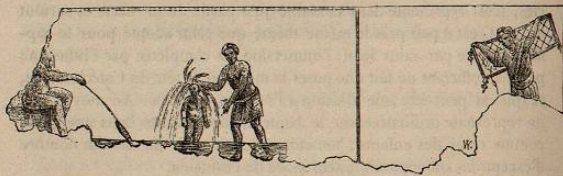
Scène baptismale. (Cimetière de Calliste.)

Cimetière de Saint-Calliste. — Dans un cubiculum construit à la fin du second siècle ou au commencement du III e et qu'on désigne sous le