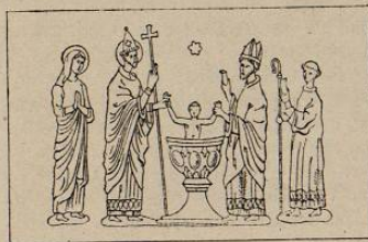
Baptême sur la chaise de saint Taurin (xiii e s.)

CHARTRES. — A la cathédrale, baptême de Clovis.