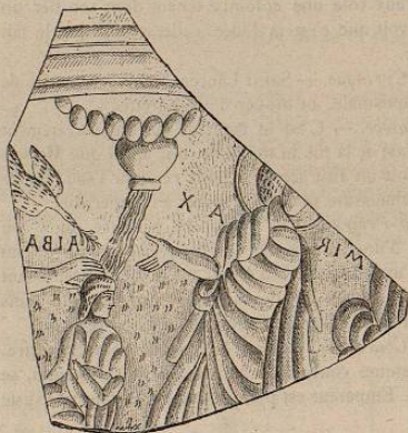
Scène baptismale. Fonds de verre du IV e siècle.

En 1875, on a découvert au Mont de Justice, près des thermes de Dioclétien, dans un oratoire privé du IV e siècle, un fragment de tasse en verre, d'une destination analogue, représentant le baptême