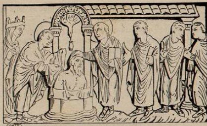
La descente céleste de la sainte Ampoule.

On conserve au Musée d'Amiens une feuille de diptyque en ivoire, provenant du cabinet de M. Rigollot. Elle est divisée en trois compartiments. Le premier représente la résurrection qu'opéra saint Remi d'une jeune fille de Toulouse. La seconde scène figure un miracle raconté par Hincmar. Saint Remi allait baptiser un malade, quand il s'aperçut qu'il n'avait pas de chrême ni d'huile de catéchumènes; il ordonne alors de poser deux ampoules vides sur l'autel et se met en prières; bientôt les deux vases furent miraculeusement remplis. Les fonts consistent dans une cuve de bois cerclée, garnie d'un drap intérieurement et extérieurement. Le baptême de Clovis est le sujet du troisième compartiment, Clovis est plongé jusqu'à la poitrine dans une cuve dont la profondeur réelle ne peut permettre que l'immersion des jambes. Saint Remi pose la main droite sur la tête du Roi. Un