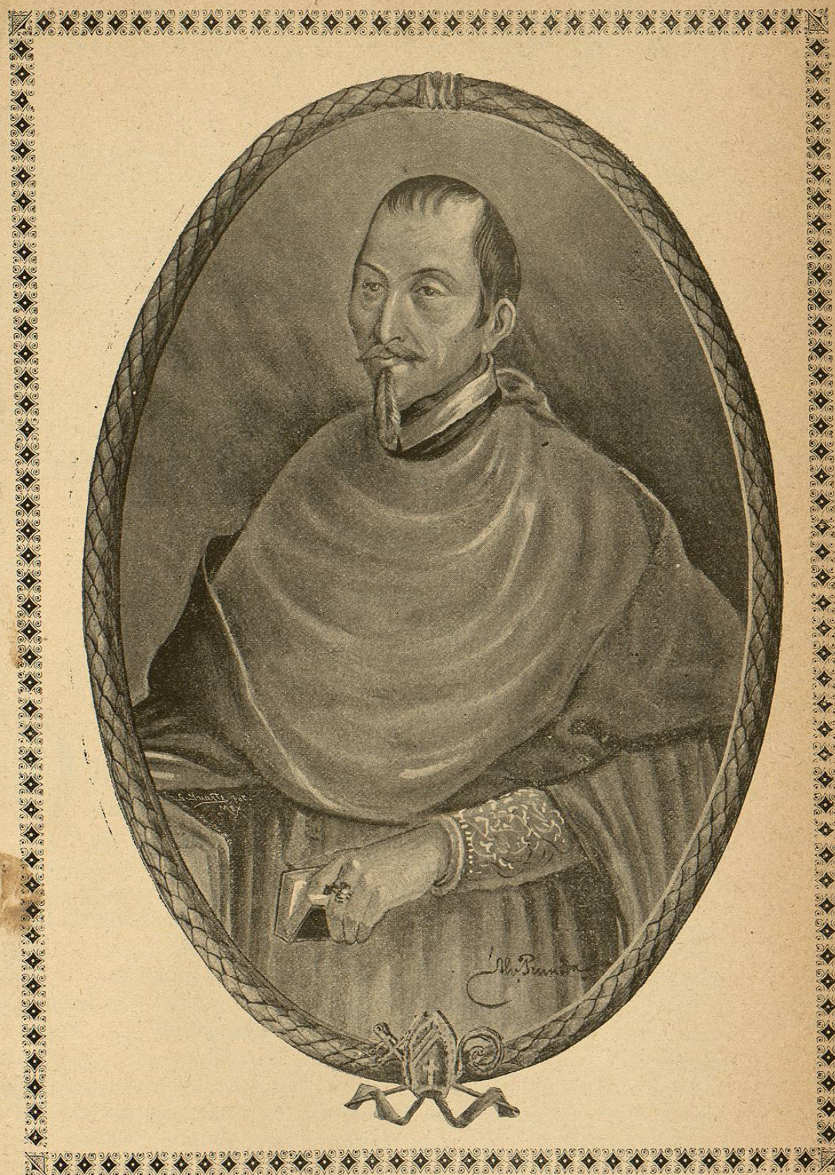
Illmo. Sr. D. Mateo Sagade Bugueiro,

natural de Pontevedra en el reino de Galicia, canónigo magistral de la Sta. Iglesia de Toledo, Dr. en Sagrada Teología, Arzobispo de México, á donde llegó el año de 1656. Consagróse el día de Santiago Apóstol. Fué acérrimo defensor de la Jurisdicción Eclesiástica. Fué llamado del Consejo Real de Indias en servicio de su Majestad y pasó á España, el año de 1661. Murió siendo Obispo de Cartagena, donde está sepultado.