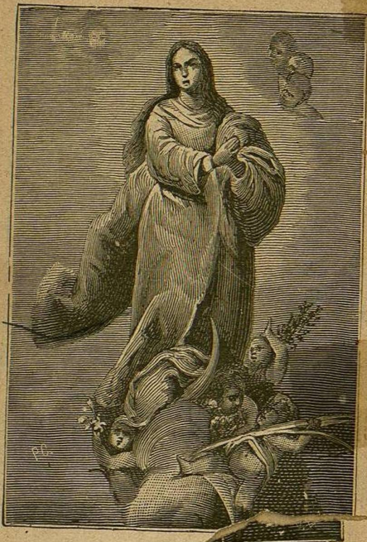
LA INMACULADA CONCEPCIÓN