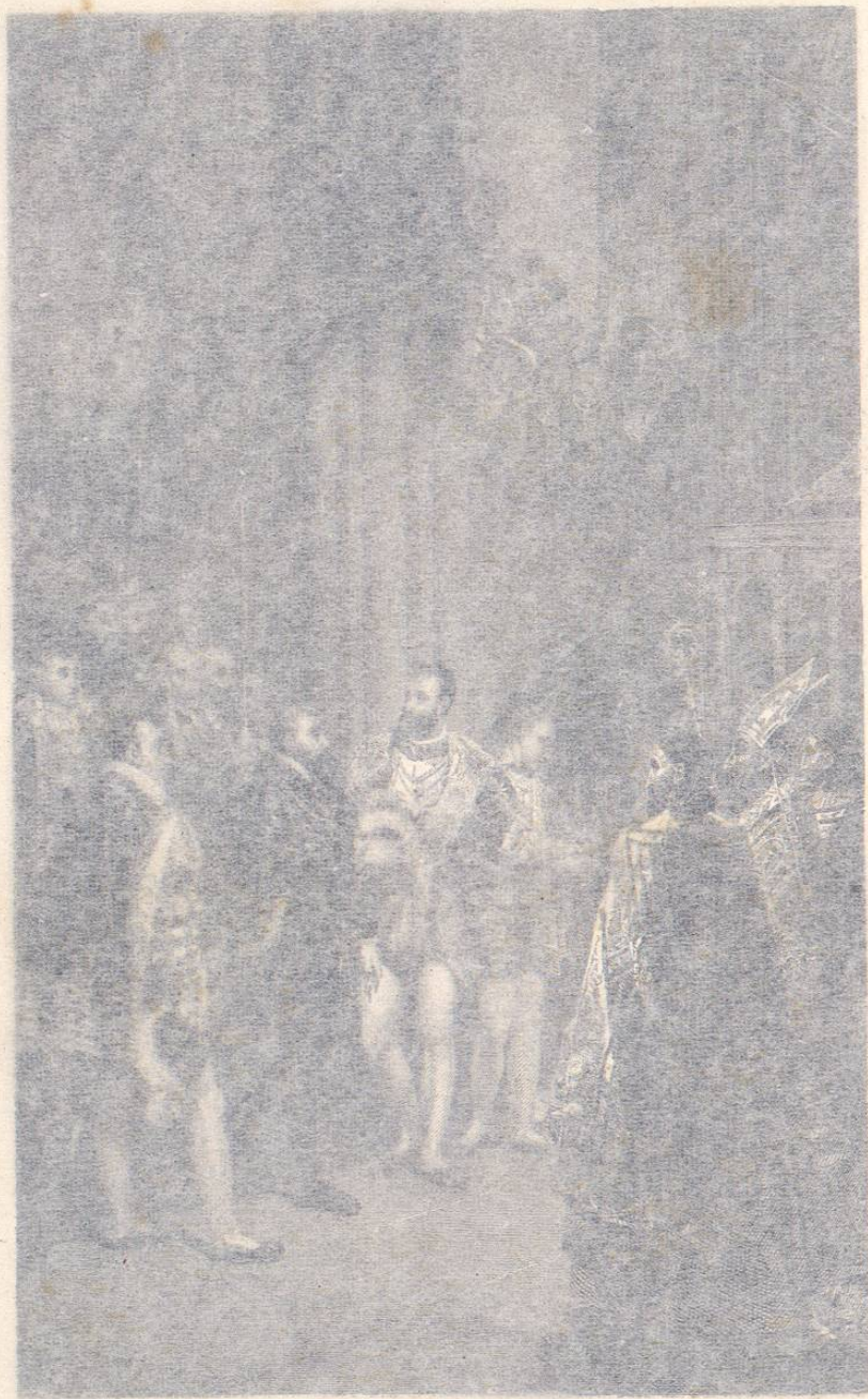
FRANCISCO I.º Y CARLOS QUINTO VISITANDO LOS SEPULCROS DE S. GONISIO