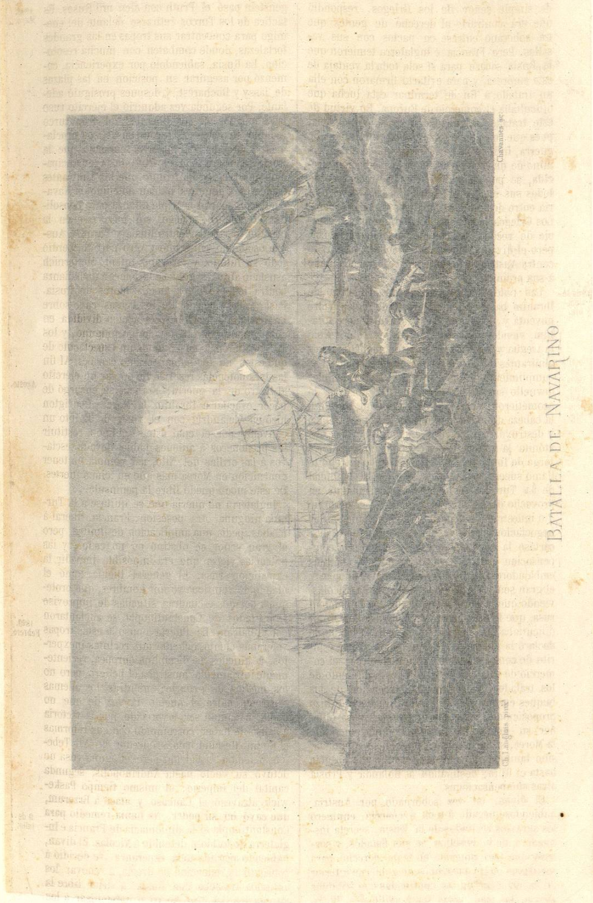
BATALLA DE NAVARINO