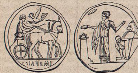
Medalla de Imera.

la imágen de la victoria; bigati , quadrigati , de la biga ó cuadriga, como las cuatro que siguen, de tamaño verdadero. Las tres primeras son de plata, y la cuarta es de cobre.