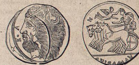
Medalla de Catania.