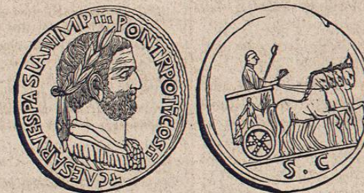
Medalla de Tito Flavio Vespasiano. — Cobre y peso de 338, 7 granos.

3º Del lugar: Aginæi las de Egina, etc.; lo mismo sucede á los bisantes de la edad média, á las colombios y á las genovinas italianas.