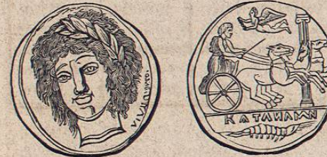
Medalla de Camarina en Sicilia.