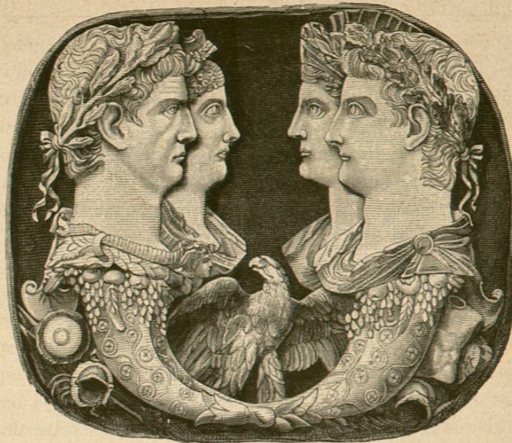
Claudio, Agripina, Livia y Tiberio (de un cameo romano)