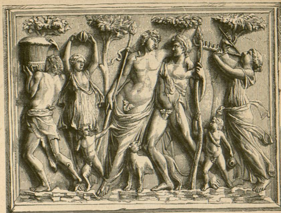
Escena de vendimia (bajo relieve del Museo de Nápoles)