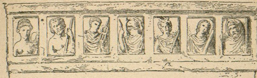
Altar de Maguncia (desarrollo del altar)