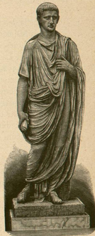
Estatua del emperador Claudio (Roma, Vaticano)