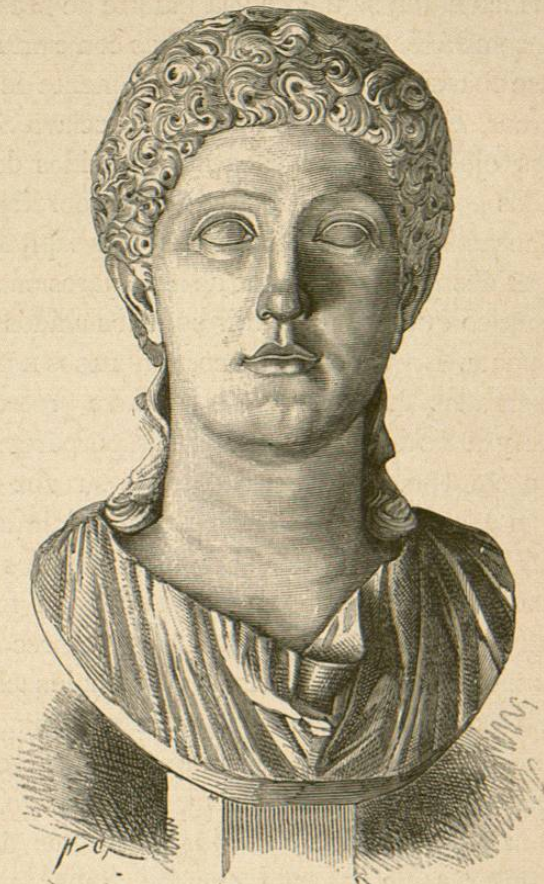
Agripina, (busto que se conserva en el Museo del Capitolio, ibid núm. 14)

fumar las guirnaldas artificiales. Agripina sólo se ocupaba en su cachorro, en su Nerón; y así que los cuidados á su cachorro se lo permitían, consagrábase á la aves, pudiéndosela llamar muy paja-