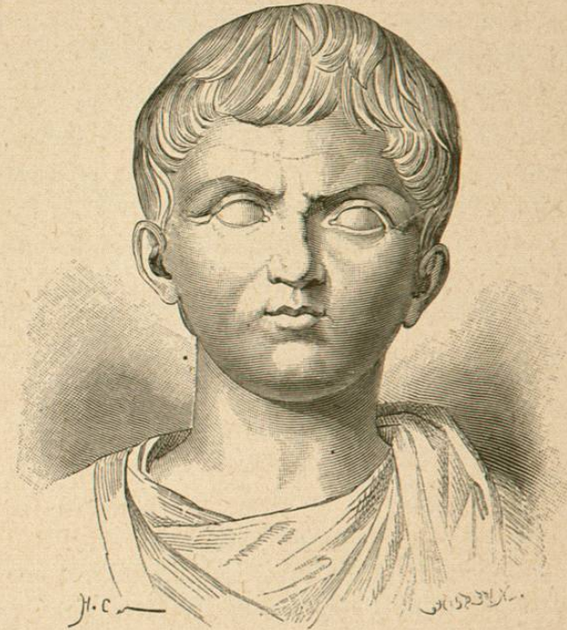
Marcelo (busto encontrado en Otricoli)

cuñada, feliz con sus dos hijos, á cual más bello y más robusto. Las historias cuentan que Octavia detestó desde aquel minuto á Livia con odio cruelísimo. «¿Qué mucho, añade Séneca, si concluyó aquella madre infeliz por detestar á todas las madres felices!» Ella, y sólo ella, tuvo la culpa de todo, por haber arrojado su endeble