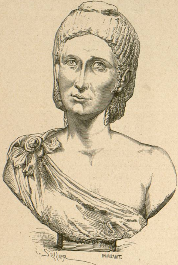
Julia, hija de Augusto (busto del Museo de Nápoles)

hijos Augusto. En ello fué tan desgraciado como el dictador Julio César. Pero tenía sobrinos, provenientes de su hermana Octavia, como Marcelo; nietos, provenientes de su primogénita Julia, como