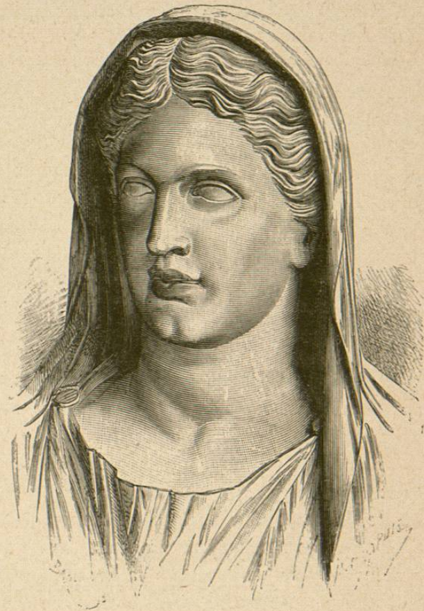
Livia, mujer de Augusto (busto de la Galería de los Oficios de Florencia)

presentaban papel importantísimo las mujeres. Octavia, la hermana mayor de Augusto, determinó ella, no solamente una parte considerable de la política interior del Imperio, sino también una