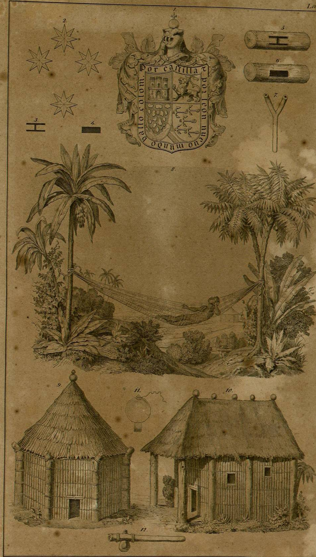
Lit. de F. Chauv.