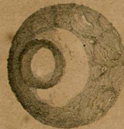
Fig. 3 a