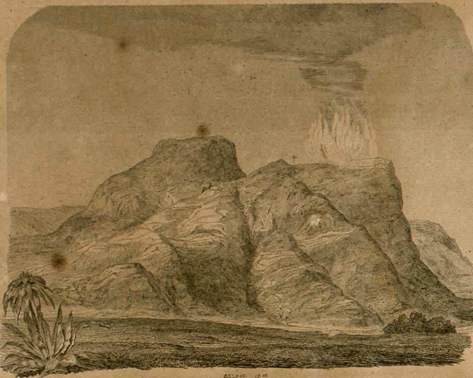
Fig. 2 a