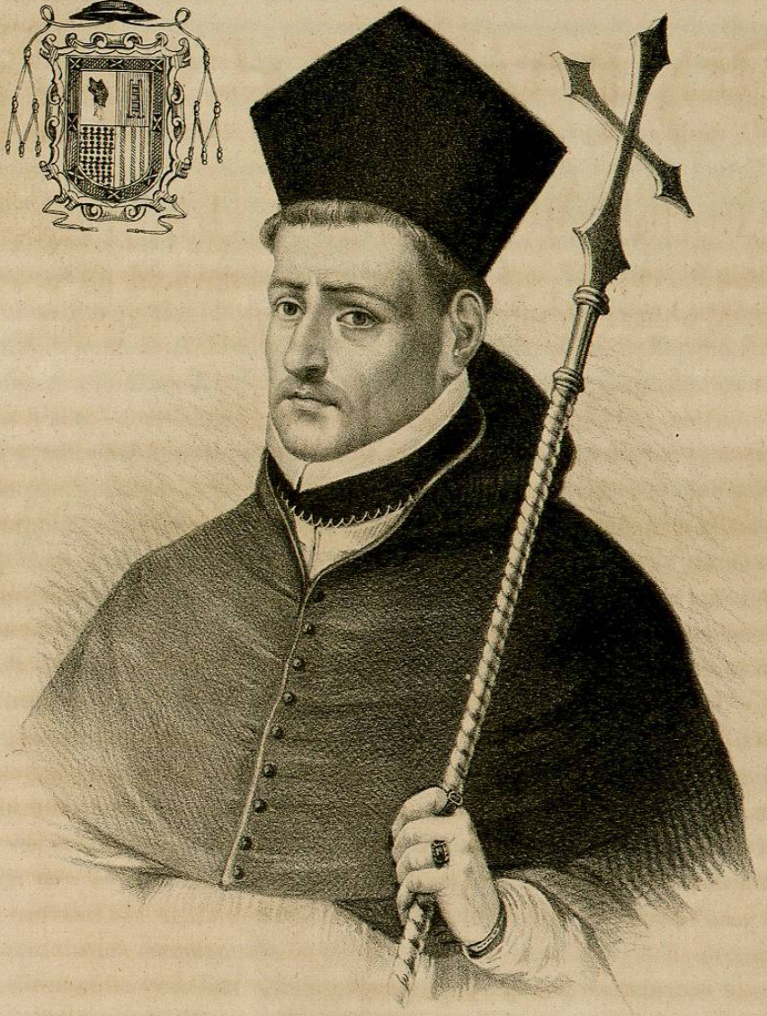
Nobilis Archiepiscopus D. Petrus moia D contreras G'Guernator-Año 1583.