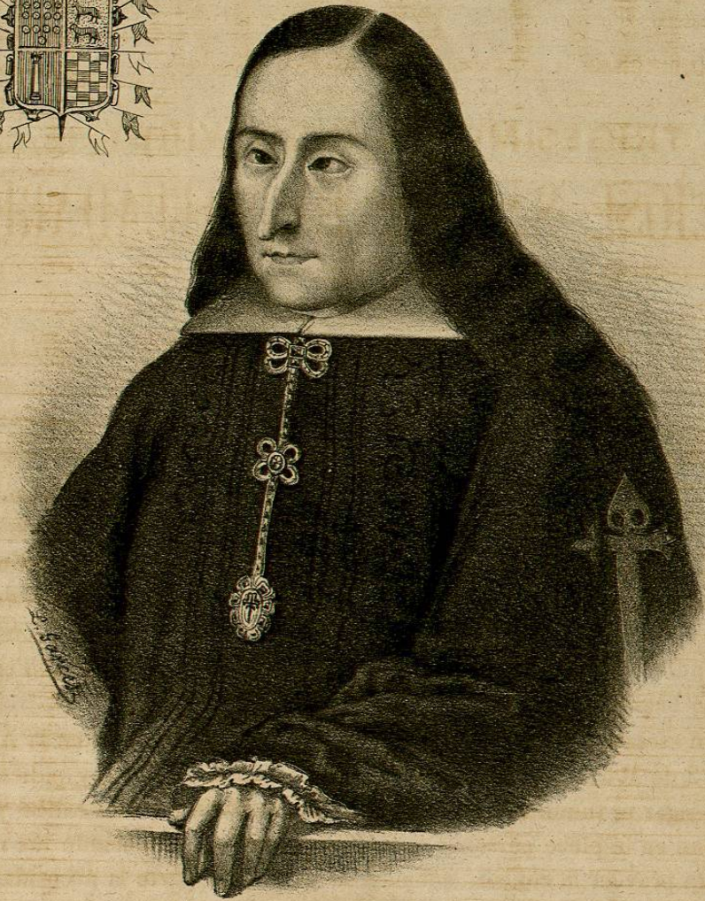
El Ex. mo Sr. D. no Joseph Sarmiento de Valladares, Conde de Moctezuma 3. o Virrey y Capp. no General.