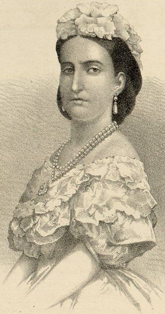
PRINCESA CARLOTA AMALIA.

Revestido Maximiliano con el carácter de Emperador de México, la nombró en Miramar por decreto de 10 de Abril de 1864, Regente del Imperio, en caso de que por cualquiera contingencia faltara el jefe del gobierno imperial. Pasó á México en unión de Maximiliano, hizo un viaje á Yucatán, y en 8 de Julio de 1866 dejó á México para regresar á Europa encargada de muy difíciles misiones; estando en Roma en 27 de Set.º del mismo año fué atacada de una inoperable enfermedad cerebral.