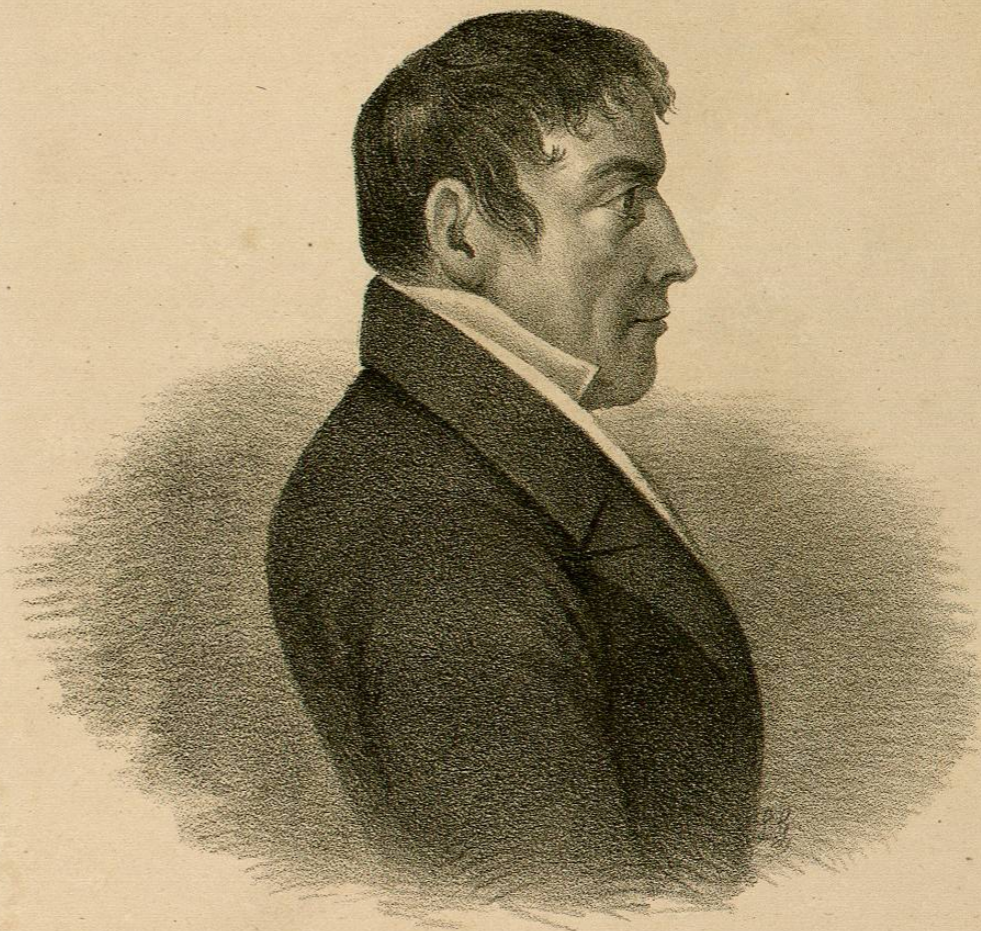
DR. ANDRÉS QUINTANA ROO.

Diputado al congreso de Chilpancingo, firmó el Acta de Independencia en calidad de Vice-presidente