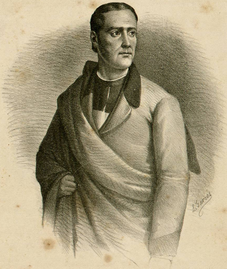
D. MARIANO MATAMOROS.

Cura interino del Pueblo de Santetelco en 1810; abnegado y fiel amigo del caudillo Morelos, dedicó su valor y su inteligencia á defender la independencia de su patria. Murió fusilado en Valladolid el 3 de Febrero de 1814.